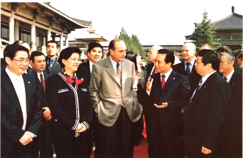
● 2006年10月28日，法国总统希拉克来我馆参观。