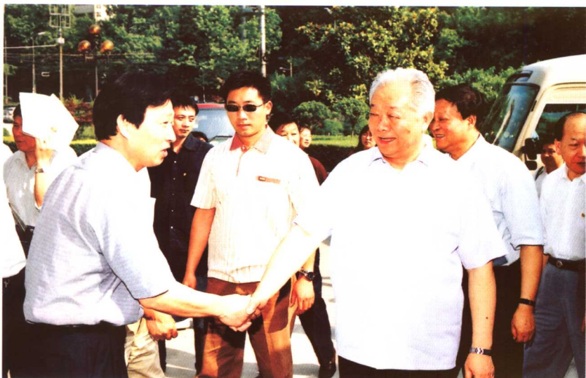
● 2006年5月19日，全国人大常委会副委员长兼秘书长盛华仁来我馆参观。