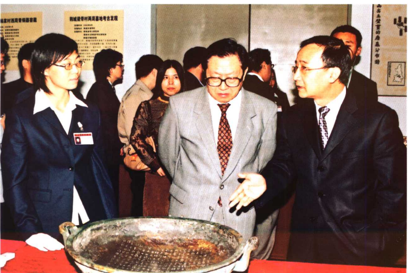
● 2006年10月26日，国务院秘书长华建敏来我馆参观。