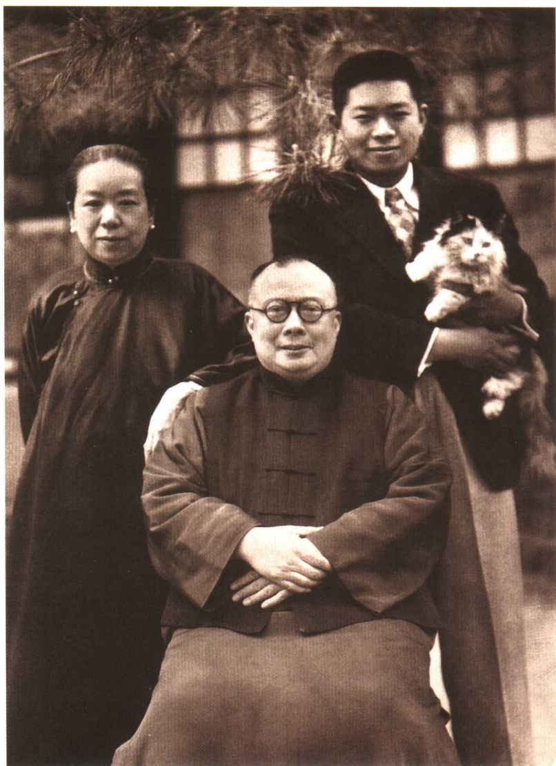
少年王世襄与父母合影