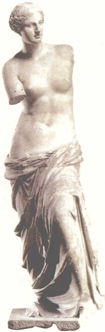
＞断臂的维纳斯 希腊化时期的大理石雕像，高204厘米，卢浮宫镇馆之宝。维纳斯是罗马神话中的爱与美神。此雕像从被发现的第一天起，就被公认为是迄今为止希腊女性雕像中最美的一尊。