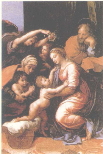
＞《法兰西斯一世的圣家族》油画。高207厘米，宽140厘米，意大利画家拉斐尔·圣齐奥作。拉斐尔是意大利文艺复兴三杰之一。