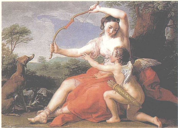
> 《戴安娜与朱比特》 油画。 高124.5厘米，宽172.7厘米， 意大利画家巴东尼作。

林梅村：“那就太多了，尤其是当年敦煌王道士卖出去的那批东西。他曾把敦煌宝物、文书，还有绢画等卖给法国的伯希和，卖给斯坦因，还卖了一些给俄国人。其中有一件文书甚至被五马分尸，一片在英国，一片在俄国。因为古董商为了多卖钱，就把文书撕开，等于一件可以卖两件的价钱。所以我们现在要研究起来很麻烦，要研究一件文书实际上也要了解其他博物馆收藏的东西。”