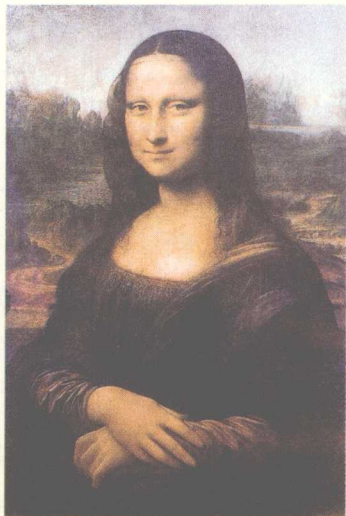
>《蒙娜丽莎》油画。高77厘米，宽53厘米，意大利画家莱奥纳多·达·芬奇作。《蒙娜丽莎》是达·芬奇从1503年开始动笔描绘的一幅肖像作品。这幅画最初在枫丹白露展出，后来移到凡尔赛宫，最后一站就是保存至今的卢浮宫。

接下来要向大家介绍的则是同样声名远驰的大英博物馆，那么，大家是否知道，大英博物馆的门票是多少钱呢？