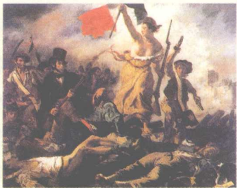
＞《引导民众的自由女神》油画。260厘米，宽325厘米，法国画家欧仁·德拉克洛瓦作。此画又名《1830年7月27日》，取材于1830年法国革命。