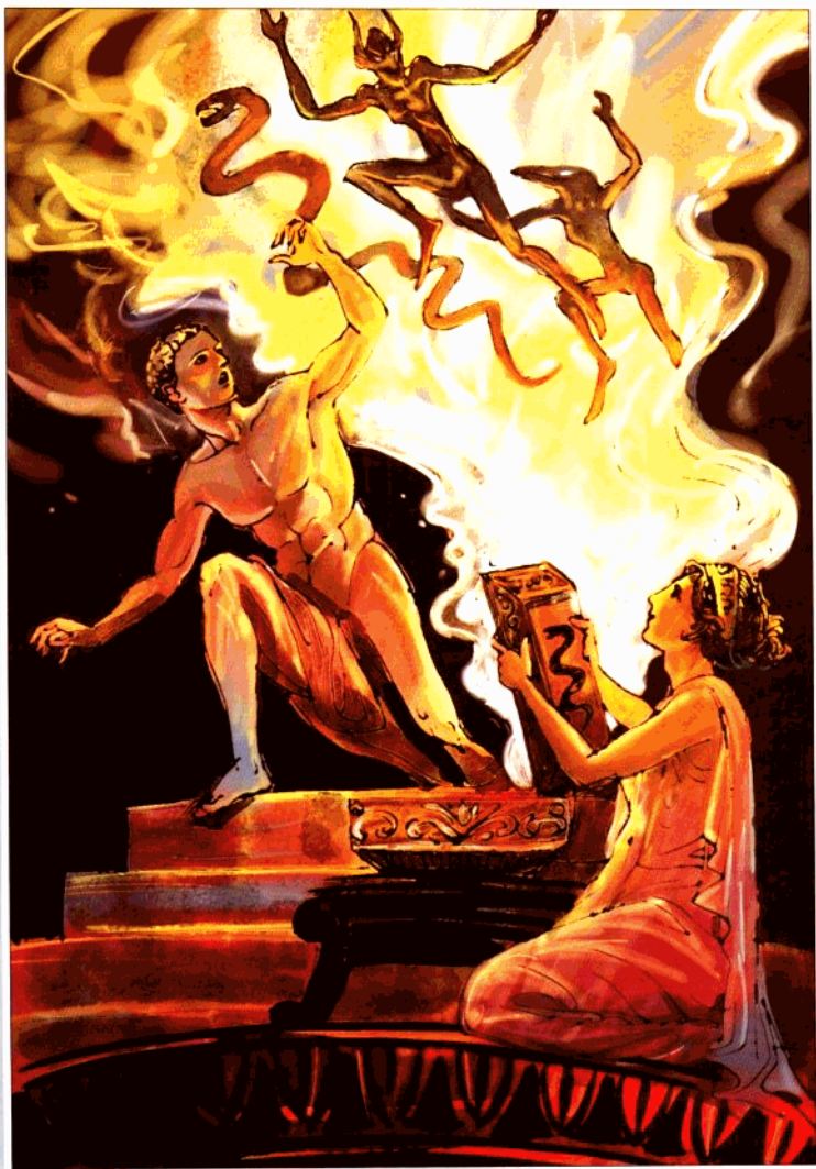
普罗米修斯与潘多拉魔盒