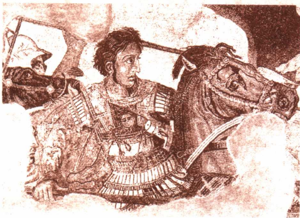
亚历山大骑马出战（油画）