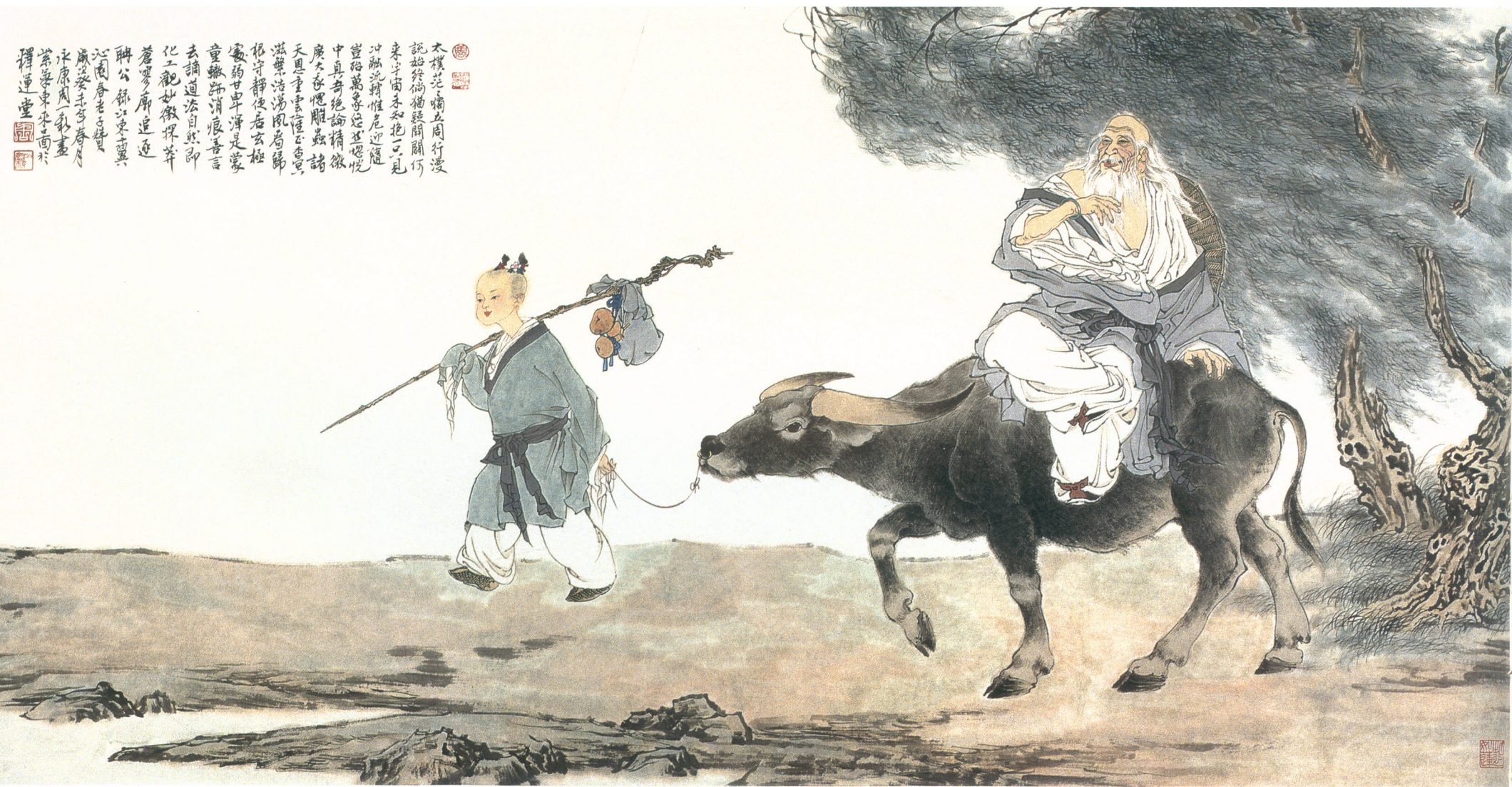
紫气东来 水墨纸本 138 × 68cm