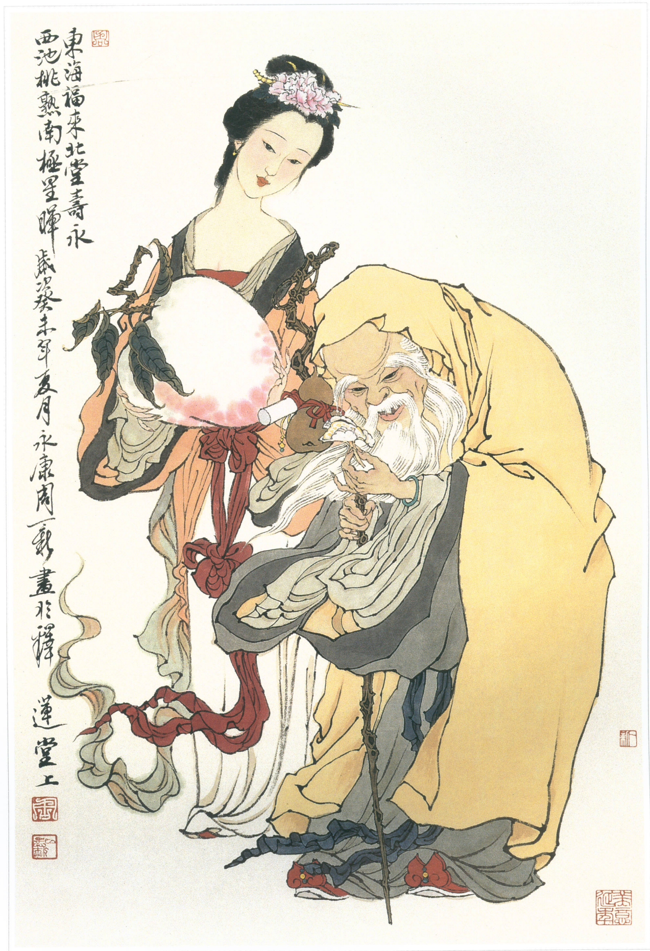
献寿图 水墨纸本 68 × 46cm