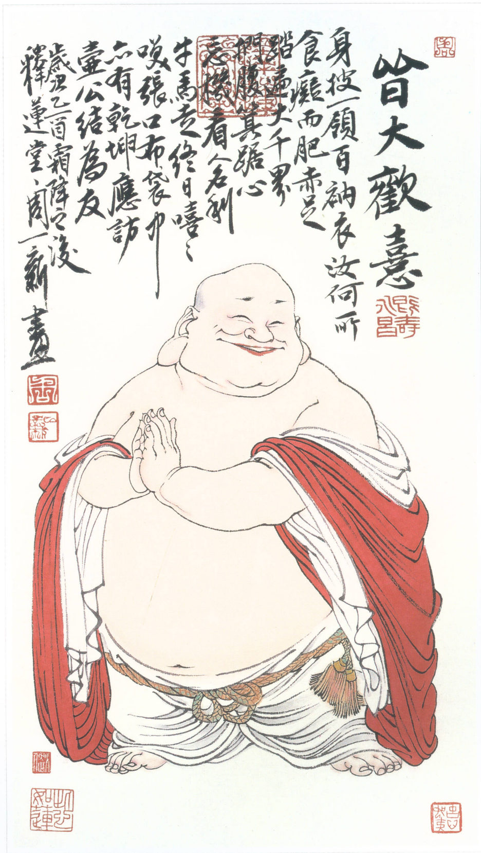
皆大欢喜 水墨纸本 138 × 68cm