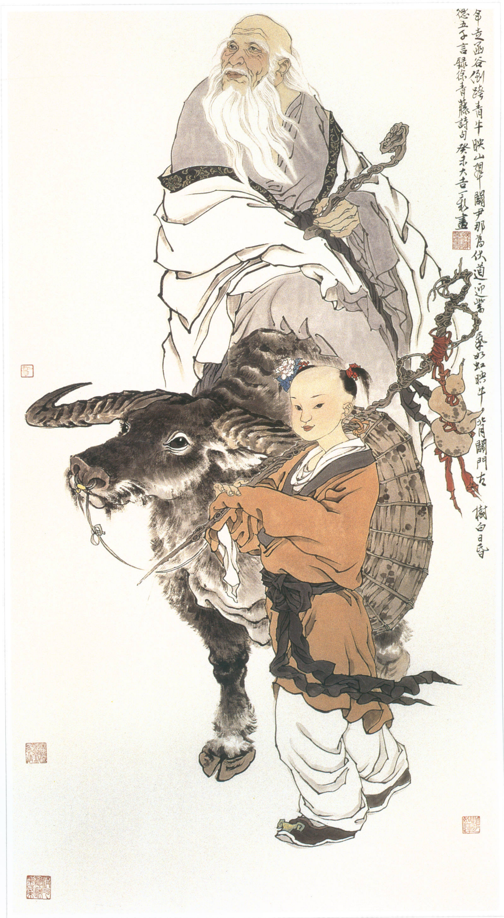
老子出关 水墨纸本 68 × 46cm