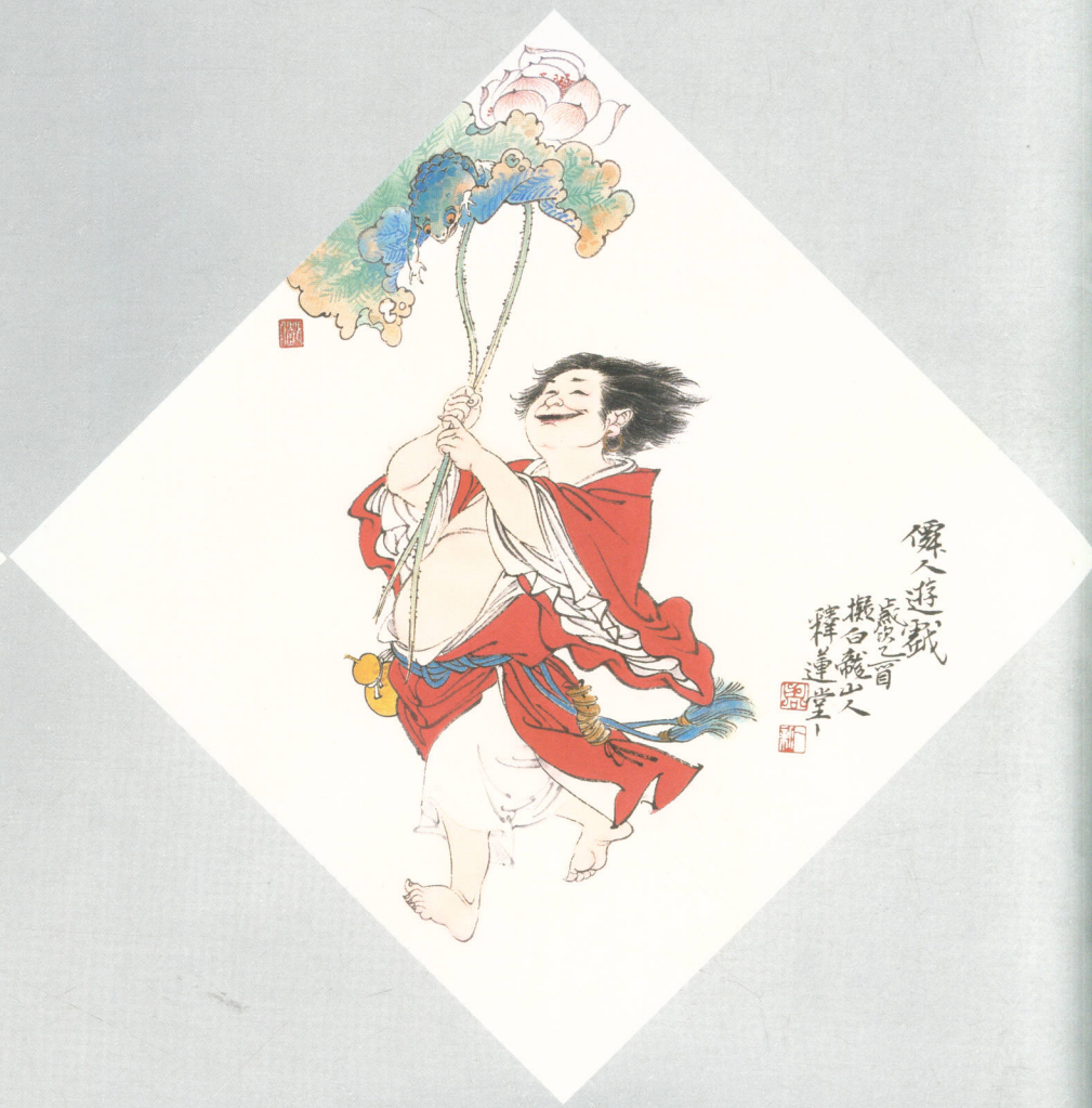
仙人游戏 水墨纸本 34 × 34cm