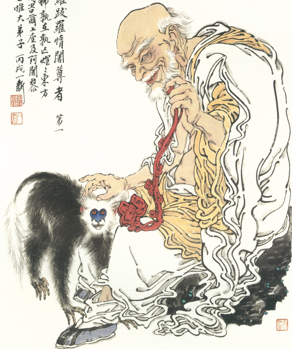
十八罗汉像（之一） 水墨纸本 68 × 46cm