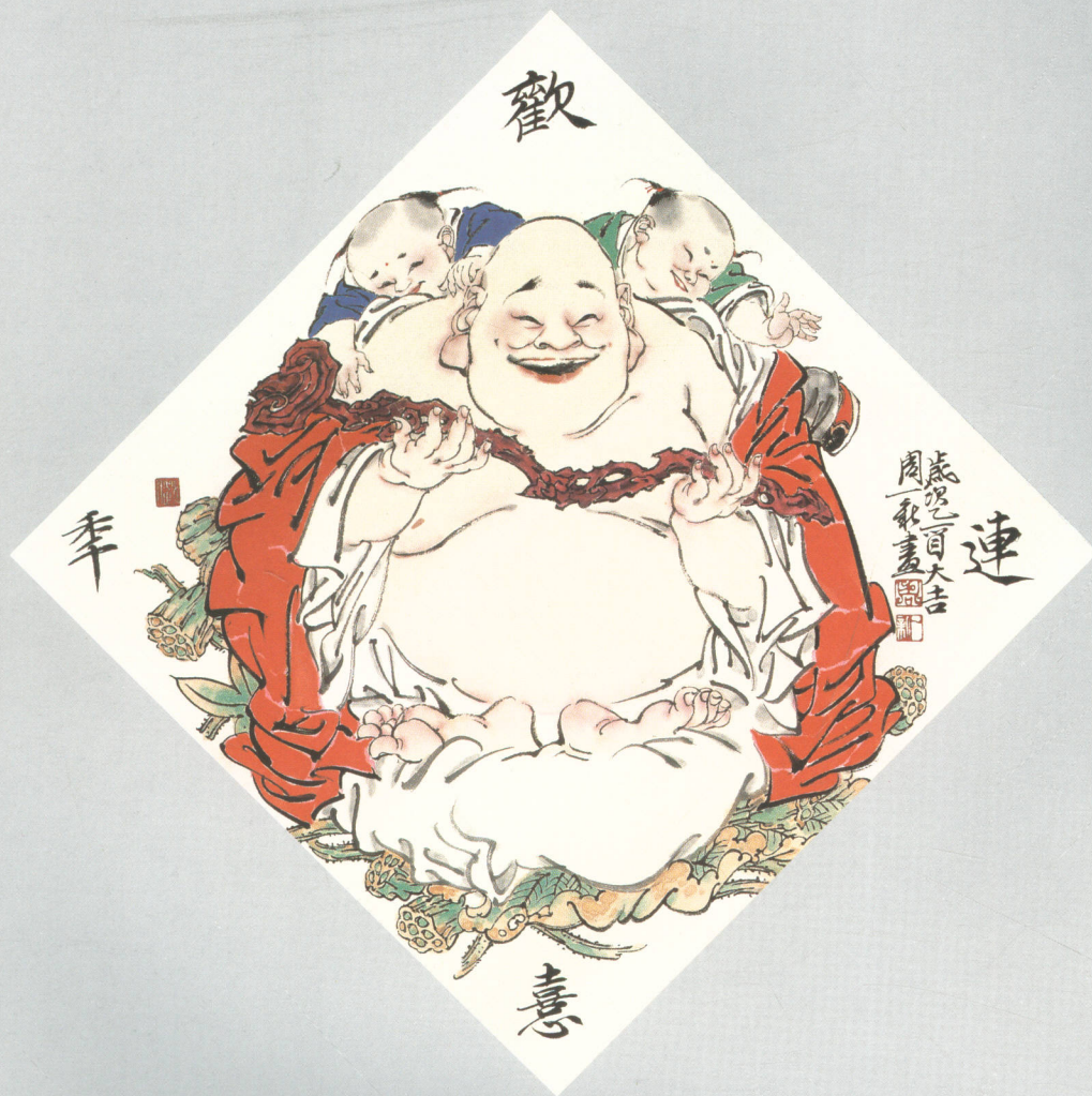
欢喜连年 水墨纸本 34 × 34cm