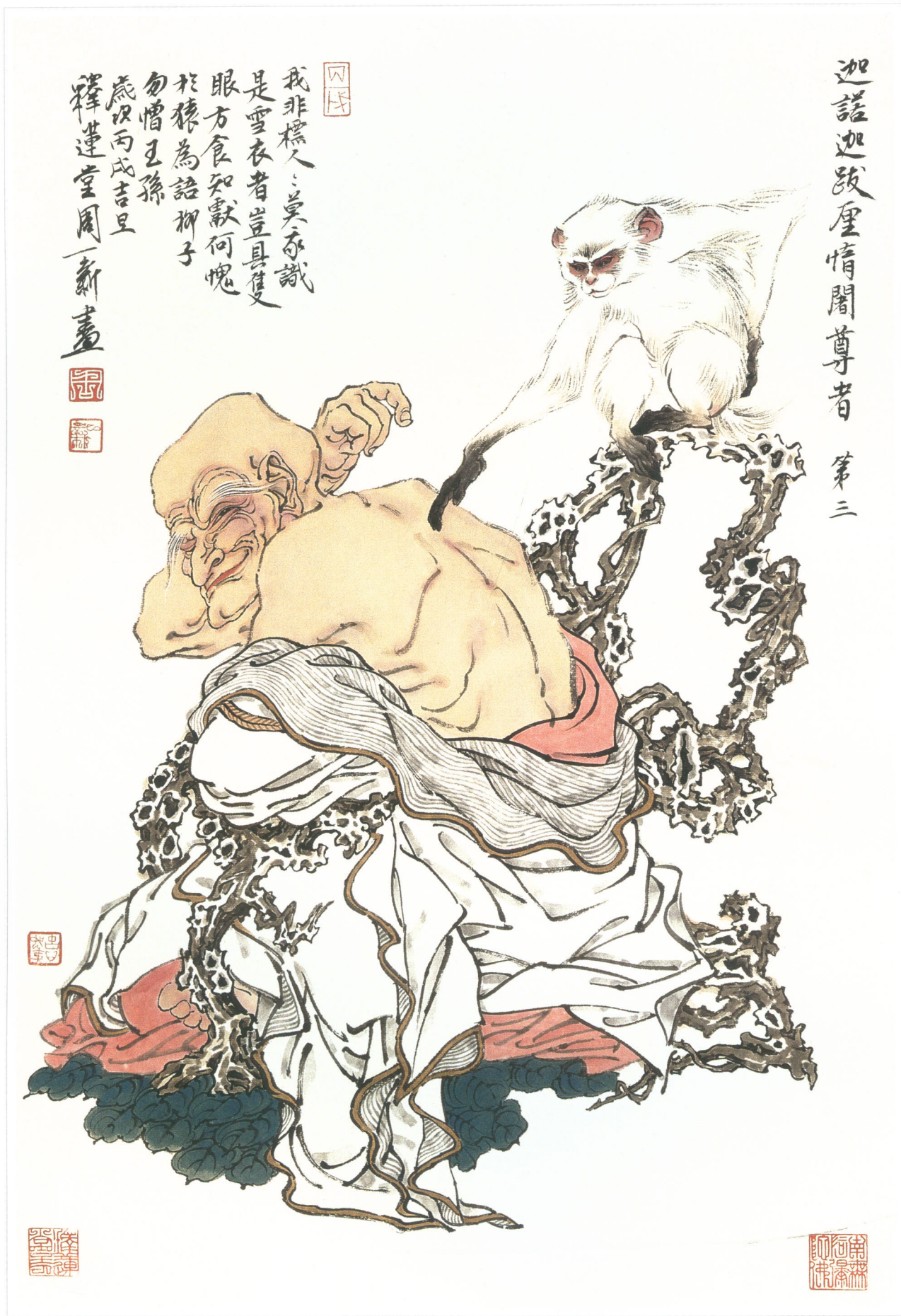
十八罗汉像（之三） 水墨纸本 68 × 46cm