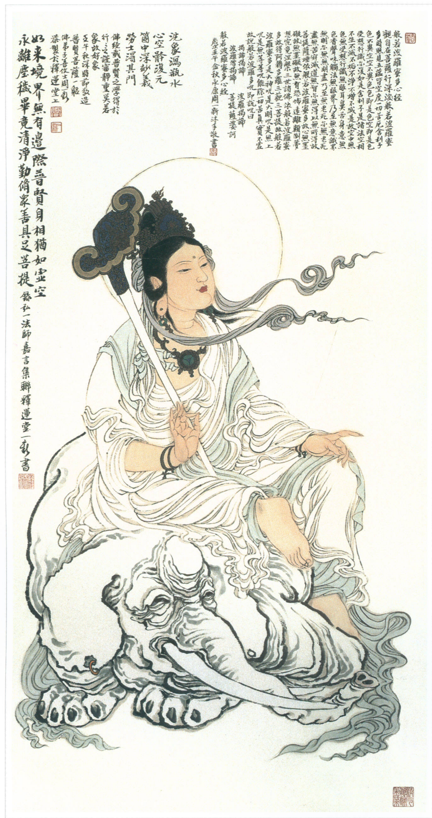
普贤菩萨宝像 水墨纸本 138 × 68cm