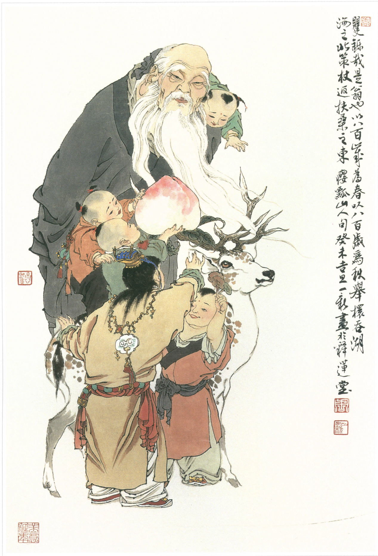
三多图 水墨纸本 68 × 46cm