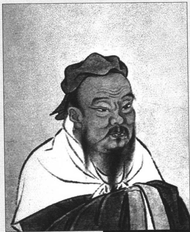
插图本论语二十讲