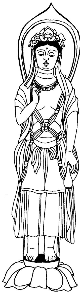
观音 石雕 隋