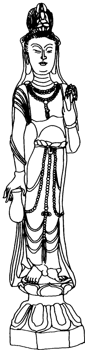
观音 石雕 北魏