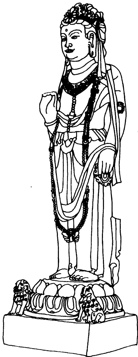
观音 石雕 隋