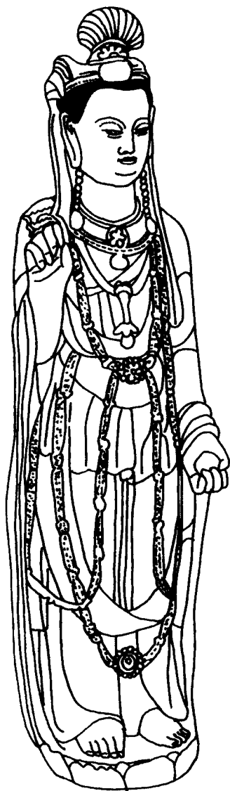
观音 石雕 隋