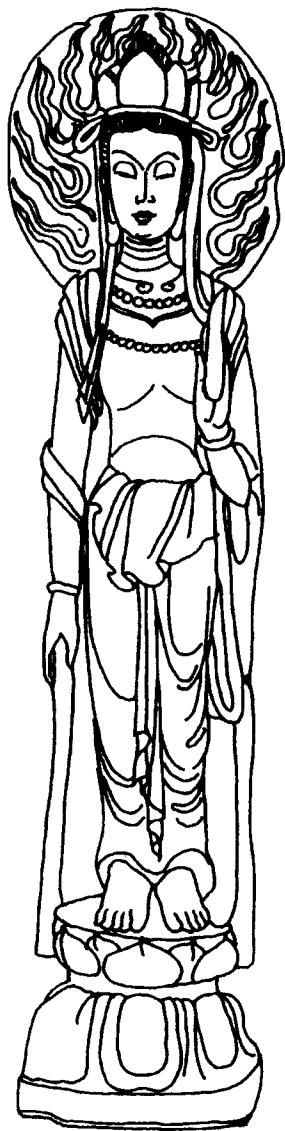
观音 石雕 北齐