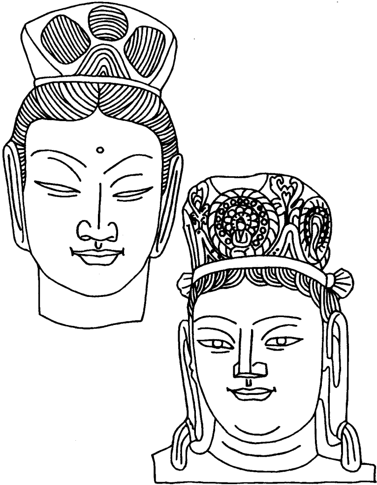
观音 石雕 北魏