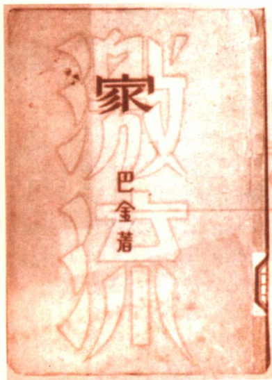
1933年5月，上海开明书店初版的《家》

“家”是与巴金一生创作密切相关的意象，甚至可以说是巴金独创的意象。家庭是社会的细胞，在中国传统的宗法制度中，“家”则更被赋以某些特殊的文化意味。因此，在家庭模式发生急剧变化的20世纪，中国先进的知识分子无不对家庭问题表现出某种特殊的关注。“五四”前夕，鲁迅的《狂人日记》率先从现代启蒙者的角度深刻地揭露了封建家族制度的弊端，巴金的许多小说，更是将对社会的批判与