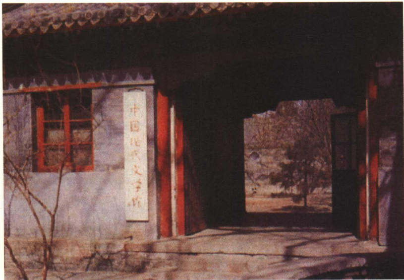
北京西三环万寿寺，中国现代文学馆旧址