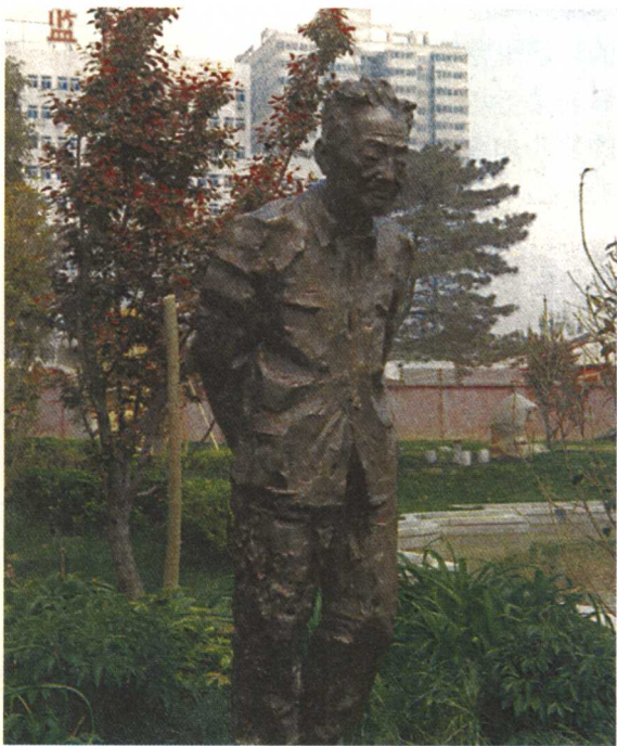
文学馆的巴金雕像

还特别值得一提的是，在中国现代文学馆内众多的作家雕像中，巴金的雕像比较特别的。他不像鲁迅的金属雕像，材质特殊，造型夸张；不像郭沫若张开双臂，仰天高呼；不像冰心那样娴静幽雅；也不像叶圣陶、老舍等几个人相聚而坐……巴金似乎偏于一角，反背双手，低着头，沉浸在一种深深的忧思之中。作家王蒙特别欣赏和称赞巴金的这座雕像，觉得它有一种引人深思的韵味。的确，这座雕像非常符合巴金的性格，惟妙地展示了巴金晚年的精神境界。