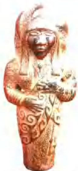
2005年8月在马鞍山·母鲁鲁村出土 人物形杖头首 sculpture painting relic. Plaque-shaped Head image: the Muzulu Village at The Scabblo Mountain Township

成了兼并五诏和其他各个小部落的宏图大业，并击退了南下深入苍山洱海地区的吐蕃入侵势力，统一了整个苍山洱海地区，在祖国西南边疆建立起第一个由乌蛮为国王、白蛮为辅佐的地方政权南诏国，以自己南诏部落名称为国家政权名称。唐开元二十六年(738年)春，皮罗阁入朝正式接受了唐王朝“云南王”、“越国公”等封号，授其子阁罗凤为右领军卫大将军，兼阳瓜州(今巍山)刺史。同年，皮罗阁筑太和城(今大理市太和村后山麓)。唐开元二十九年(741年)，皮罗阁从蒙舍川迁居太和城，并筑龙首(今上关)、龙尾(今下关)和大磴城(今喜洲)，派兵驻守，拱卫南诏国都太和城。从皮罗阁开始，南诏的政治经济文化中心从蒙舍川移到大理苍山洱海地区，蒙舍川为南诏的故都，皮罗阁派子阁罗凤留守蒙舍川故都蒙舍城。从细奴罗于唐贞观初年进入蒙舍川到皮罗阁四代，共经营蒙舍川114年，蒙舍川史称“南诏发祥地”。