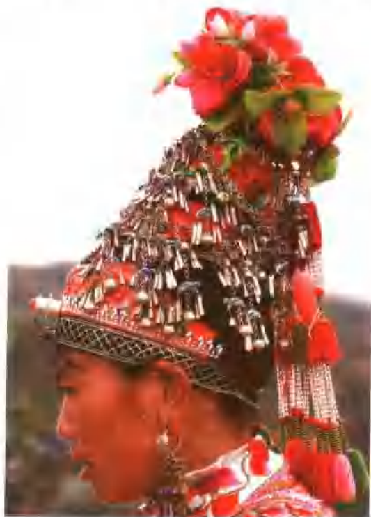
庙街镇·小麻桔房 中年妇女头饰 Middle-age women headdress Xuomajifang Village The Temple Market Township

彝族左氏承袭蒙化知府先后17人,史称蒙化府是云南明、清时期辖境最广、势力最强、统治时间最长的土知府。其17任土知府是左禾(土知州)、左伽、左琳、左瑛、左铭、左正、左文臣、左柱石、左近嵩、左星海、左世瑞、左嘉谟、左麟哥、左元生、左长泰、左长安、左荫曾。清咸