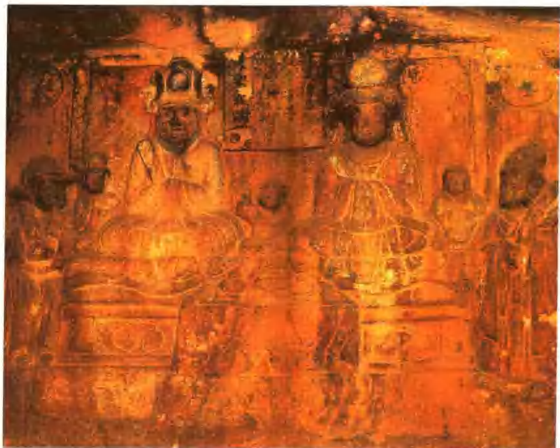
剑川·石宝山 古代彝族男女服饰（细奴罗“全家福”）

巍山是个多民族聚居区，主要居住着汉、彝、回、白、苗、傣傣等世居民族，其中彝族是巍山最古老的民族，人口众多，分布在全县广大地区。彝族先民在两汉时，史称“嵩、昆明”；唐代时，史称“乌蛮”和“乌蛮别种”（南诏王族属）；元、明、清时，史称“罗罗”或“僰