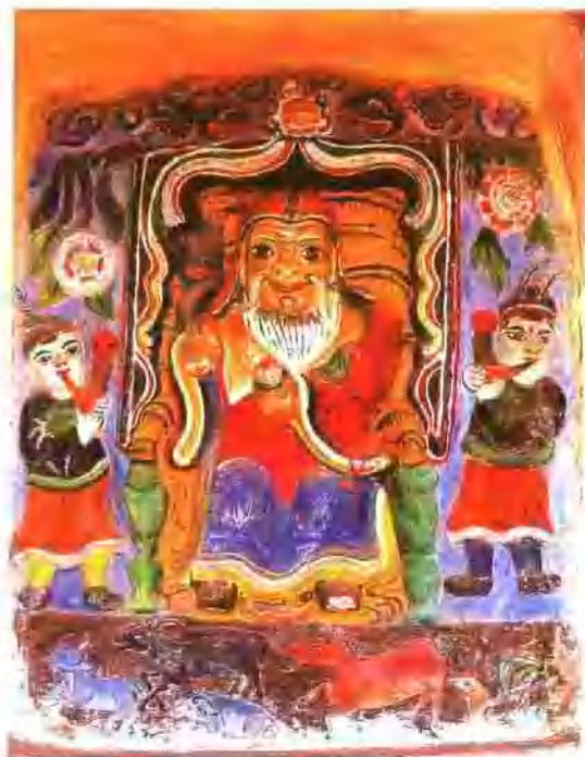
庙街·大麻秸房村观音庙 芦笙拜观音石刻(明) Ming Dynasty Stone Carved with Flute Music-Bamboo-mouth-string (huise) instrument (Lushui) and image of guanyin —— Tathagata Worship

其子孙罗盛、盛罗皮、皮罗阁先后继位，继续经营蒙舍诏，接受唐王朝巍州刺史、台登郡王、越国公特进开府仪同三司云南王等封号，使蒙舍诏的政治、军事势力远远超过其他五诏。当时，大理苍山洱海地区的六诏互不臣属，各自为政，同时，吐蕃(今西藏藏族的先民)的势力也深入到苍山洱海地区，对唐王朝设在姚州的都督府形成威胁。为了控制苍山洱海地区，唐开元二十年(732年)，细奴罗的曾孙皮罗阁继承南诏王位后，进谏剑南(今四川)节度使王昱，请求合并六诏为一诏，立即得到剑南节度使王昱的支持，上报唐王朝得到批准。从是年开始，南诏王皮罗阁开始兼并其他五诏。于唐开元二十五年(737年)，完