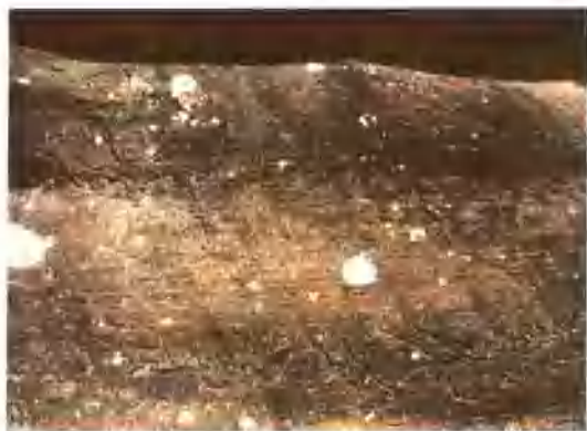
四川凉山昭觉博什瓦黑摩崖石刻“南诏王出行图” Stone Images of Outgoing of Nanzhao King Youshilong (843-877 AD) At Boshiwadhe in Zhaoyue County Liangshan Yi Autonomous Prefecture Sichuan

巍山彝族是一个显赫的民族,在中国历史上,曾创造了本民族辉煌的历史,同时也为云南谱写了光辉灿烂的历史。唐初,在祖国西南边疆的苍山洱海和红河流