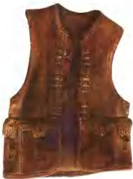
鹿皮锁褂 The Deer-skin vest