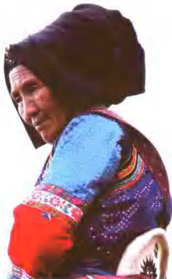
庙街镇·大麻结房 老年妇女头饰 Old-Age woman headdress Damaojiefang Village, The Temple Market Township

元末，巍山的彝族开始崛起，先有左氏彝族逐步得到元朝统治者的信任，先后在大理府、曲靖宣慰司、顺宁府任职。元至正年间，有左政子先在大理府任职，后到曲靖宣慰司任都事，后来左政子的孙子左青罗又在顺宁府任同知，官由八品“都事”升为五品官“土同知”。至此，作为南诏后裔的彝族从南诏被颠覆之后，默默