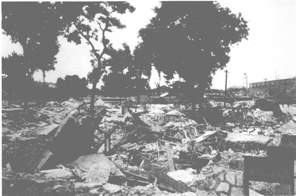
◎ 图为路北区被震毁的居民区