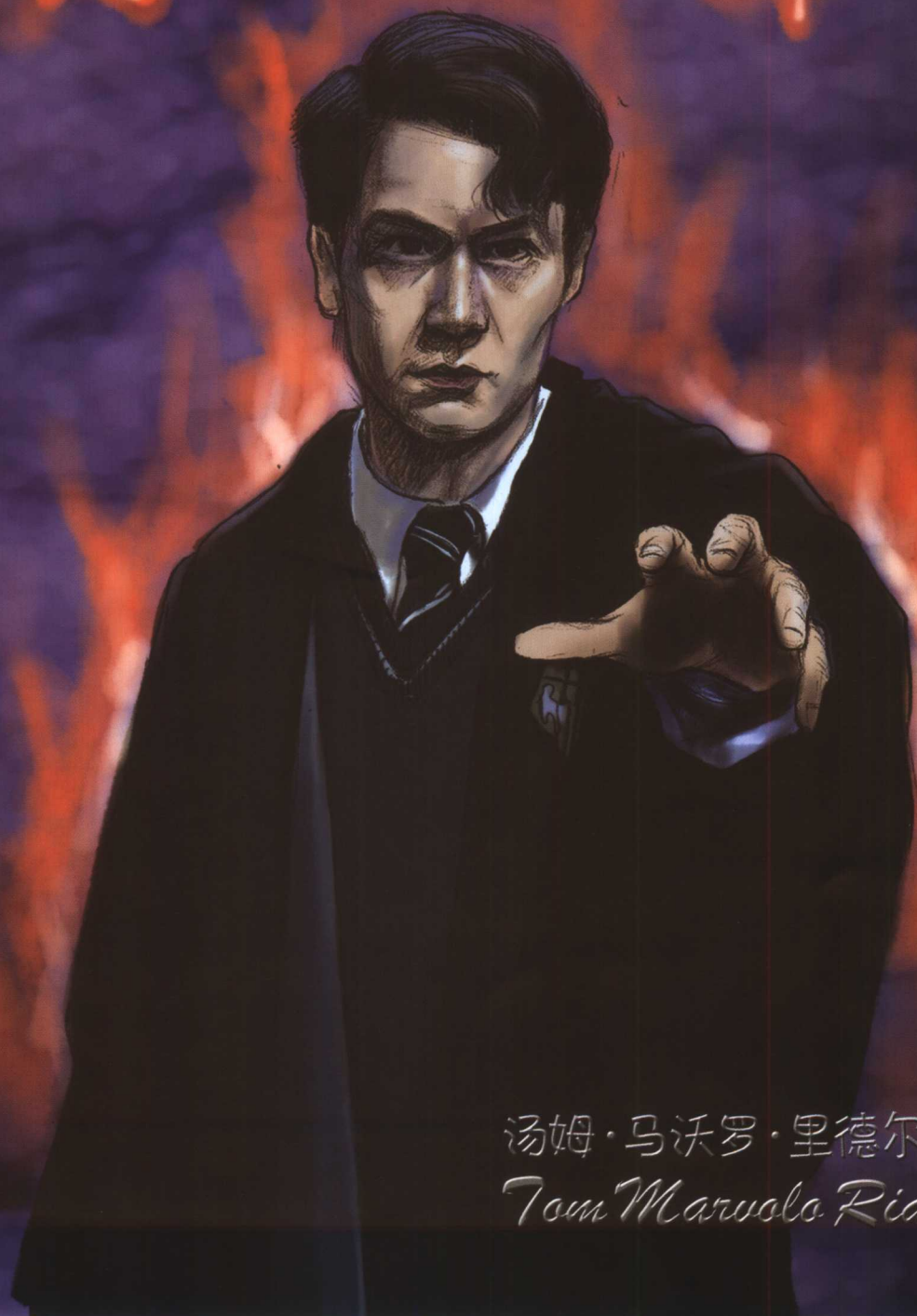
汤姆·马沃罗·里德尔 Tom Marvolo Riddle