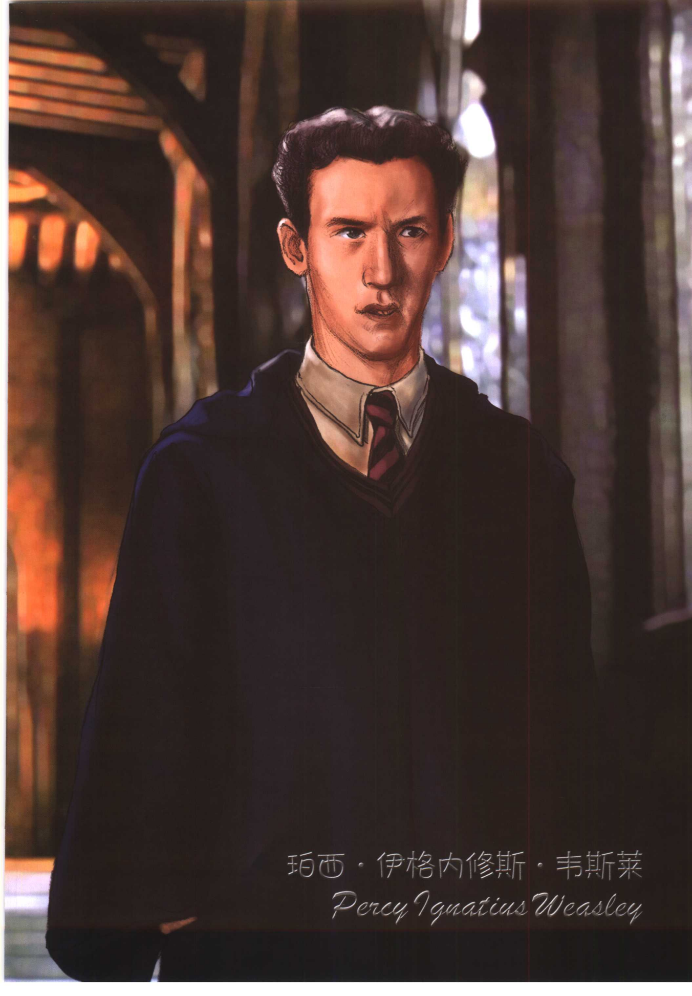
珀西·伊格内修斯·韦斯莱 Percy Ignatius Weasley