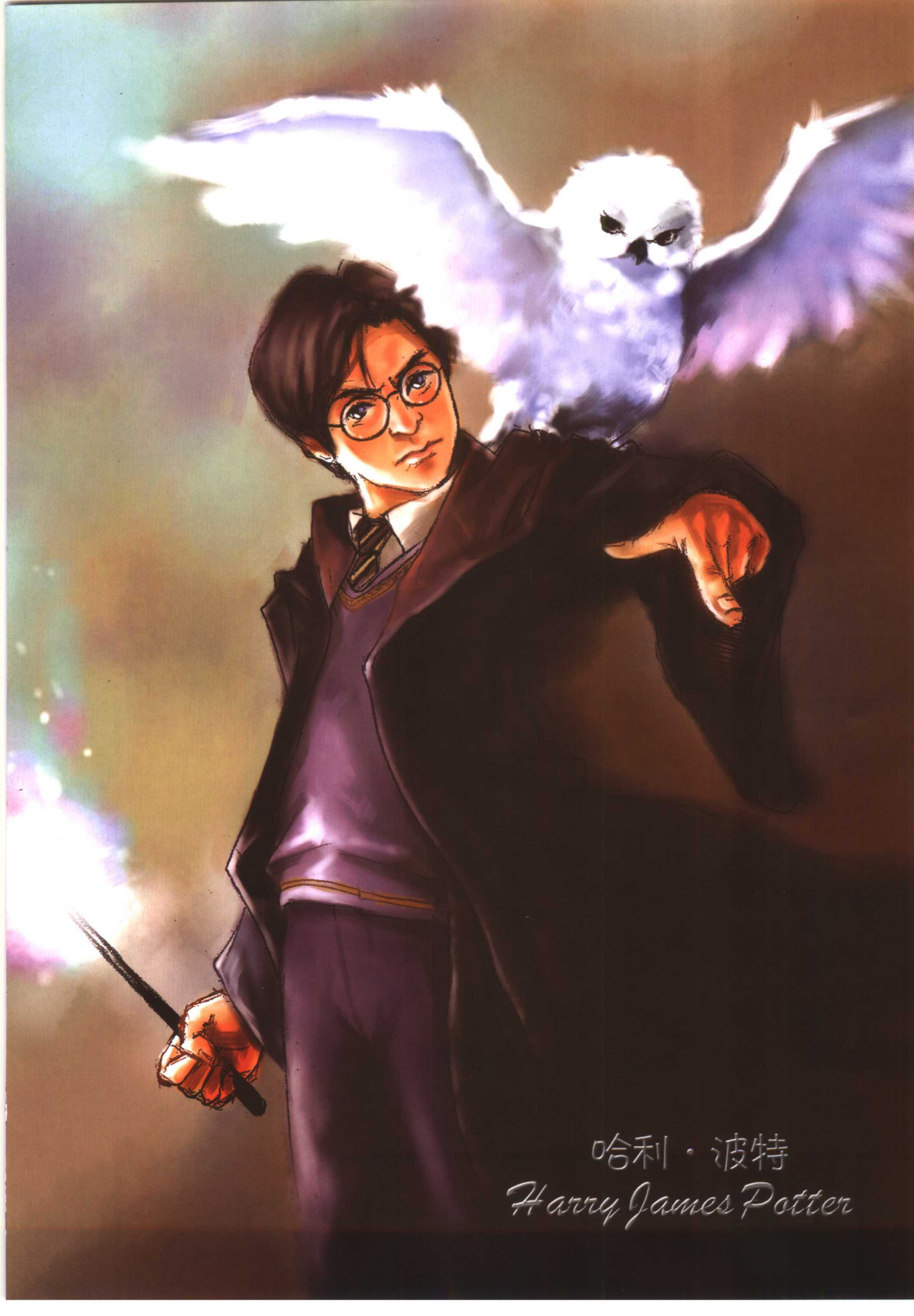
哈利·波特 Harry James Potter