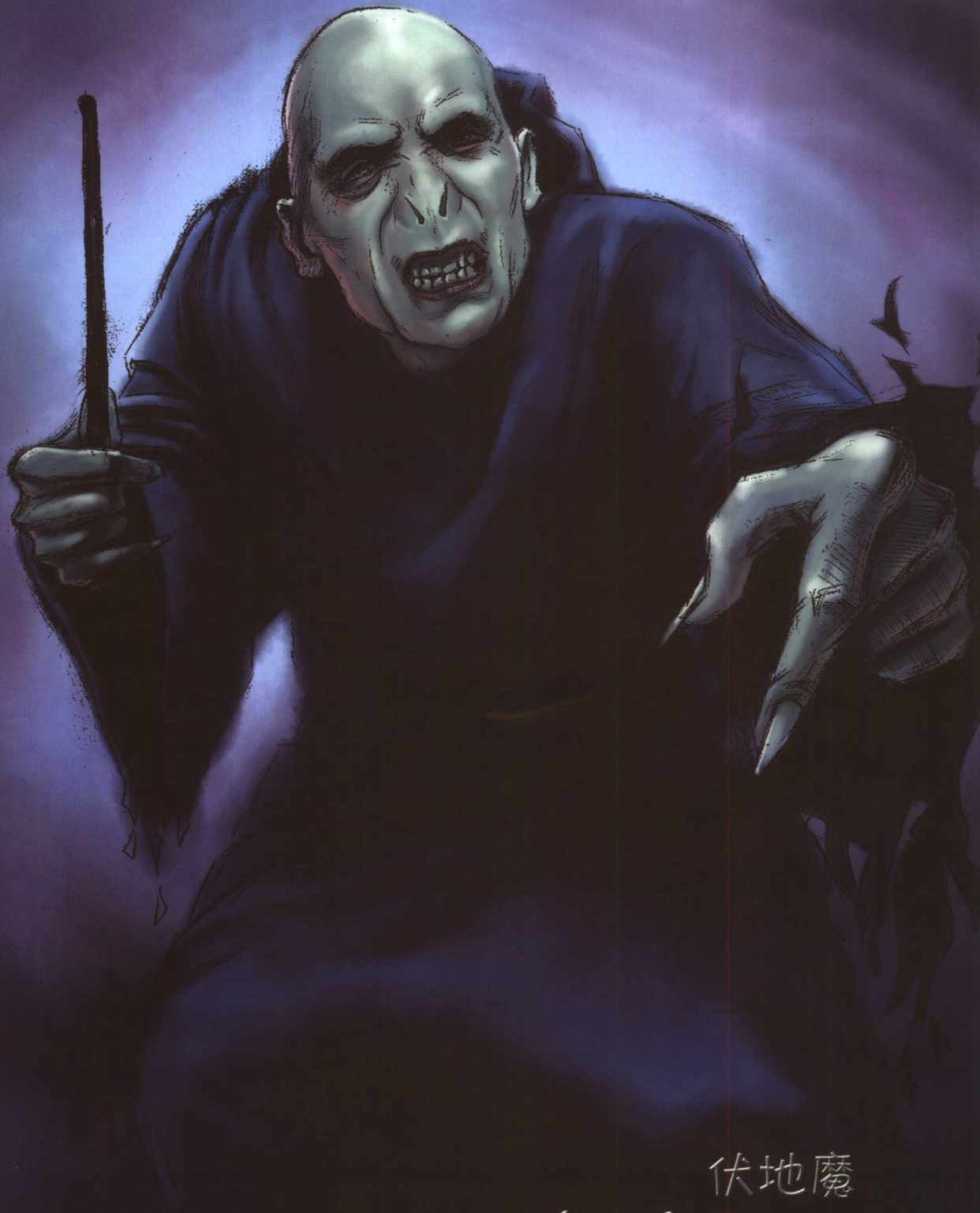
伏地魔 Lord Voldemort