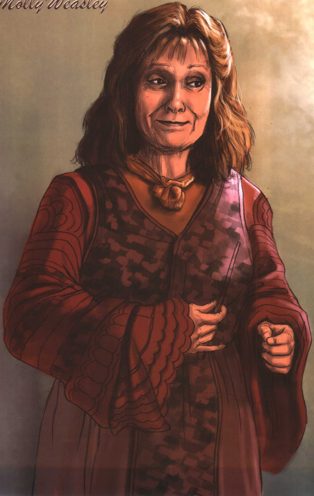
莫丽·韦斯莱 Molly Weasley