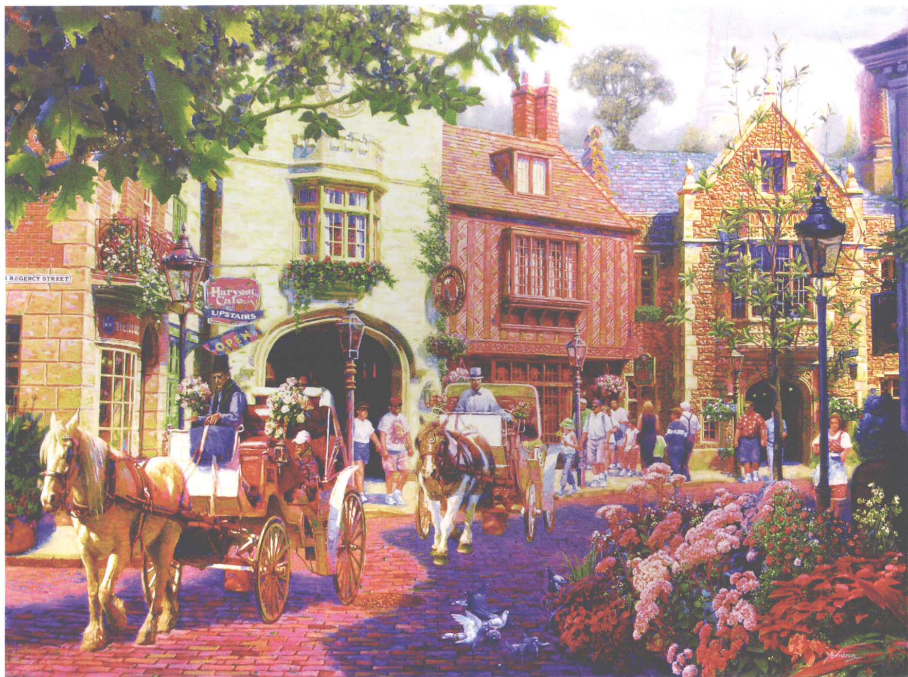
小镇 油画 102CM×76CM SMALL TOWN, OIL ON CANVAS 40"×30" スモール・タウン