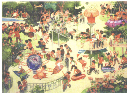
年画 1978年上海人民美术出版社出版 1978 CHINESE NEW YEAR POSTER (SHANGHAI PEOPLE'S FINE ARTS PUBLISHING HOUSE) 年画 「上海人民美術出版社」