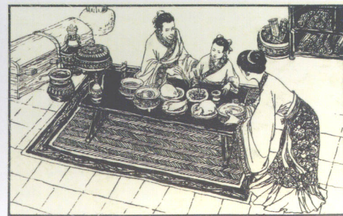
曾子杀猪 (连环画) 1983年上海人民美术出版社出版 CHINESE HISTORICAL COMIC (SHANGHAI PEOPLE'S FINE ARTS PUBLISHING HOUSE) 曾子殺猪 「80年代コミック・ブック」 「上海人民美術出版社」