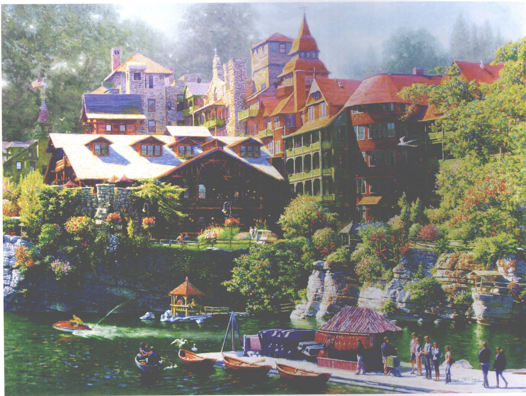
甜蜜的家 油画 102CM×76CM SWEET HOME,OIL ON CANVAS 40"×30" スイート・ホーム