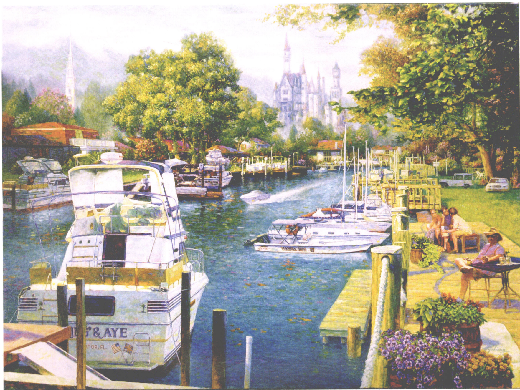
平静的瞬间 油画 102CM×76CM QUIET MOMENT,OIL ON CANVAS 40"×30" 静かな瞬間