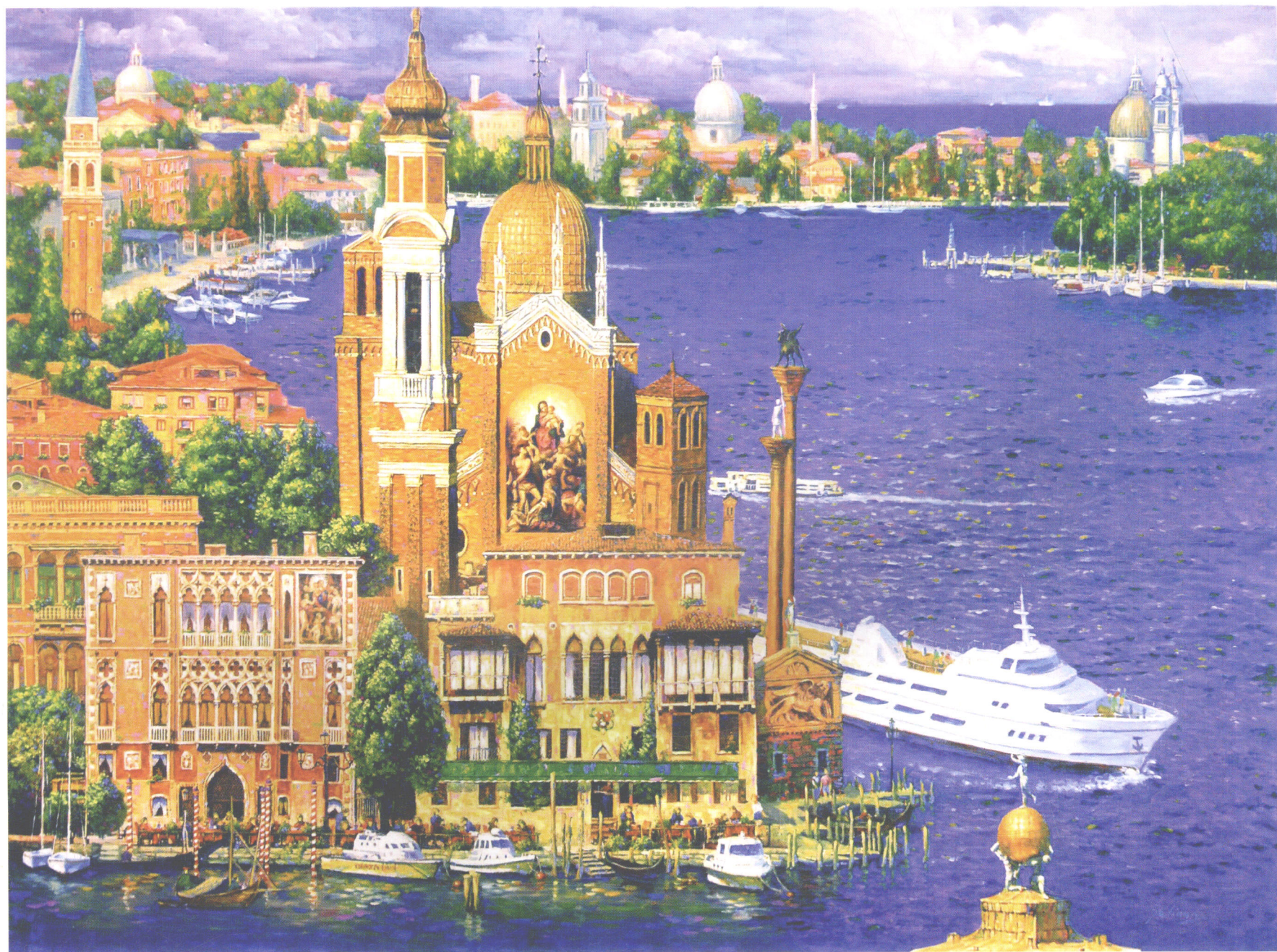
蓝色的梦 油画 102CM×76CM BLUE DREAM, OIL ON CANVAS 40"×30" ブルー・ドリーム