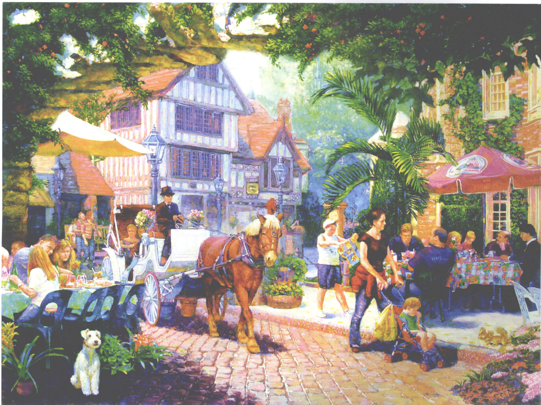
午后闲情 油画 102CM×76CM AFTERNOON LEISURE,OIL ON CANVAS 40"×30" 余暇な午後