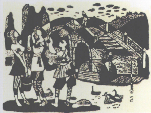
江南小景 版画 1986年 COUNTRY VIEW 江南の景色 版画