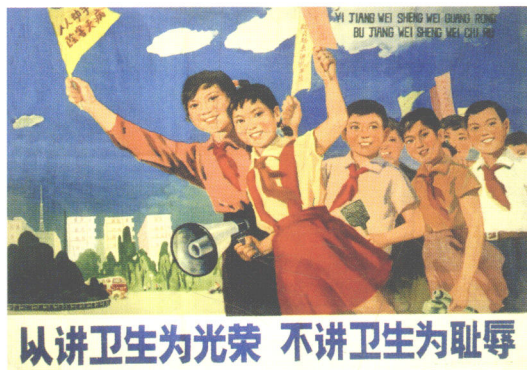
宣传画 1977年上海人民美术出版社出版 1977 POSTER (SHANGHAI PEOPLE'S FINE ARTS PUBLISHING HOUSE) ポスター 「上海人民美術出版社」