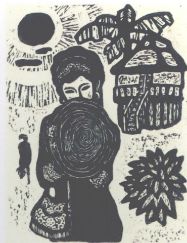
边寨少女 1986年 中国版画艺术杂志发表 COUNTRY GIRL CHINESE ENGRAVING ART MAGAZINE 村の少女 「中国版画芸術雑誌」登載