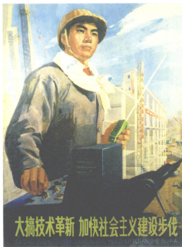
宣传画 1975年上海人民美术出版社出版 1975 POSTER (SHANGHAI PEOPLE'S FINE ARTS PUBLISHING HOUSE) ポスター 「上海人民美術出版社」

由于王也良先生是受过中国和美国美术教育的职业画家，因此他觉得东西方人民有着非常不同的文化习惯。东方人绘画较务实，讲究基本功。例如欣赏一幅画作，人们会分析这幅画的素描关系和色彩关系。如果这幅画的结构正确，前后层次到位，虚实适当，透视正确，用色真实，质感分明，加上描绘仔细等等，那么大家会认为这是一幅好的精品。在美术教育方面，许多院校也特别注重扎实的基本功教育。而美国人习惯创新，非常讲究个性化，善于从个性和风格的角度来欣赏美术作品。毕加索，凡高和莫奈等大师的美术作品都具