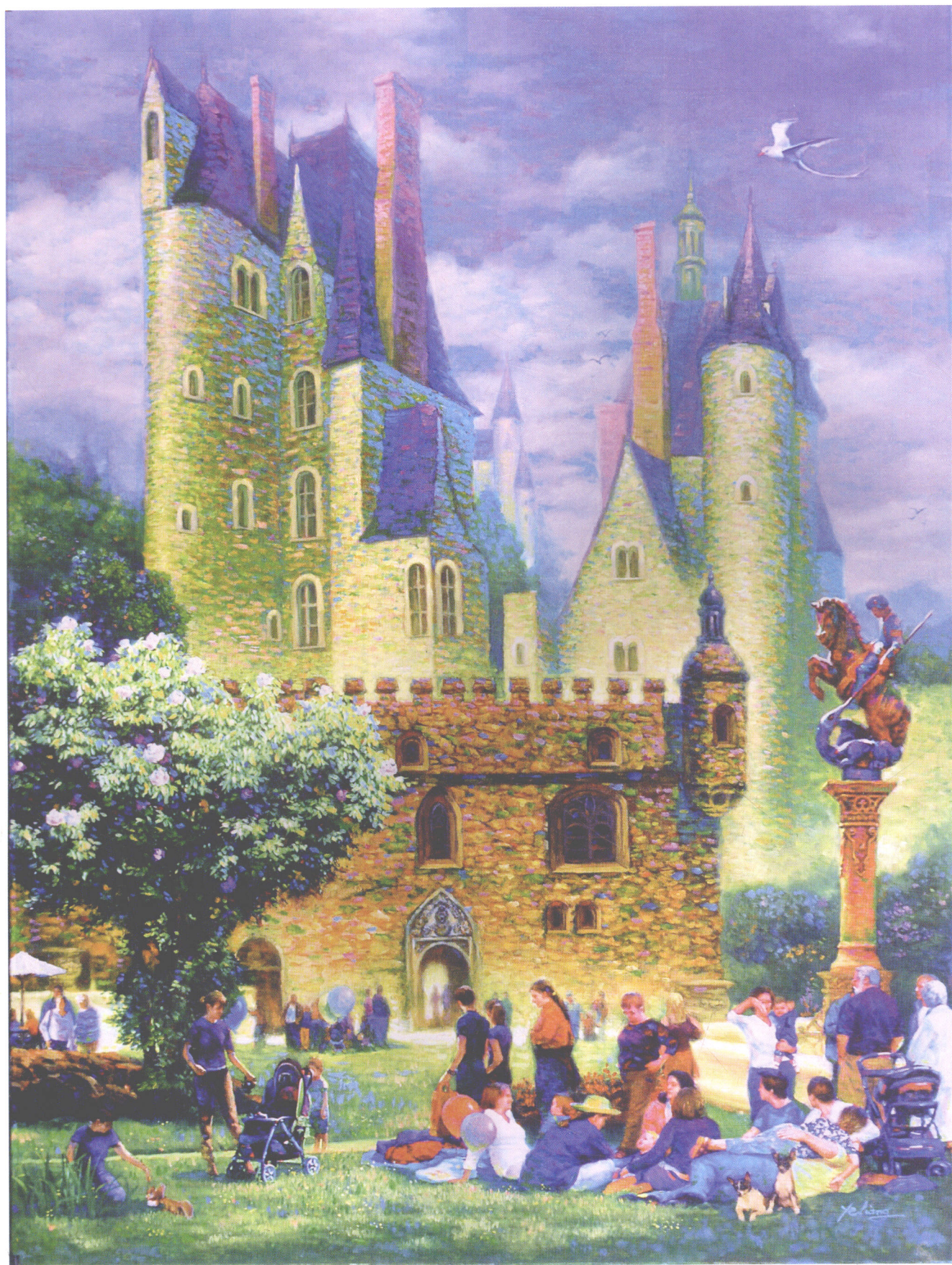
古堡 油画 102CM×76CM GRAND CASTLE ,OIL ON CANVAS 40"×30" 大邸宅