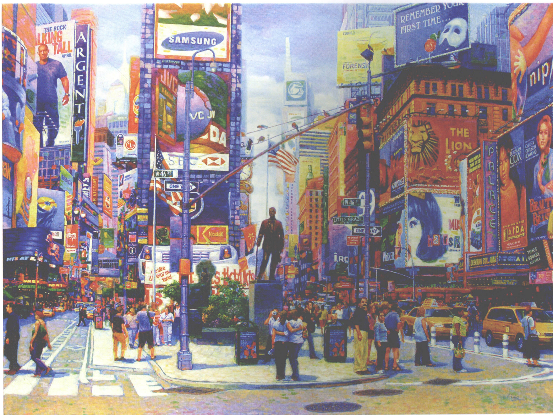
时代广场 油画 102CM×76CM TIME SQUARE, OIL ON CANVAS 40"×30" タイム・スクエア