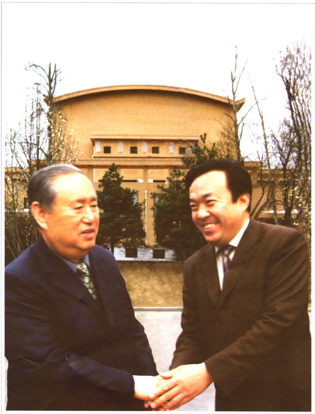
原中共中央政治局委员、全国人大常委会副委员长姜春云接见作者