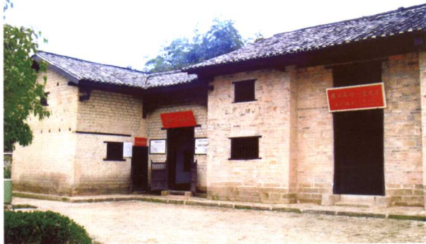
毛泽东旧居——茅坪八角楼