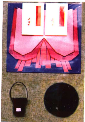
毛泽东在井冈山使用过的油灯、砚台和他写下的两本著作