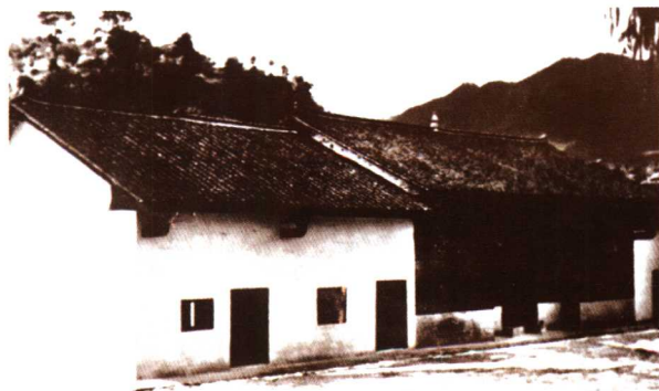
湖南酃县水口建党旧址——叶家祠