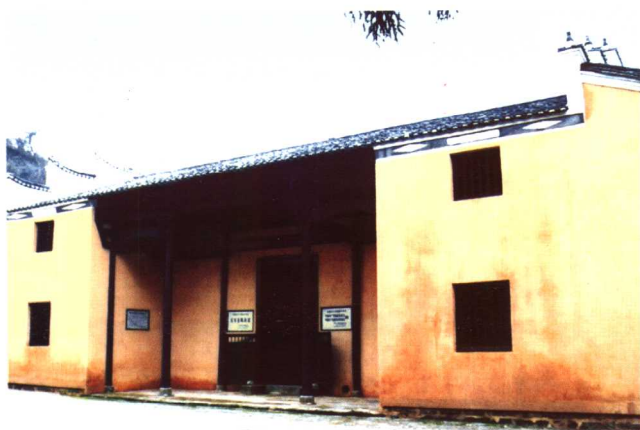
中共湘赣边界秋收起义前委、中共湘赣边界特委旧址——茅坪攀龙书院