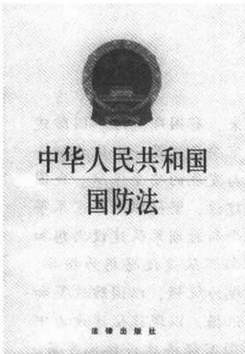
图 1-1 《中华人民共和国国防法》

把侵略作为国防对象，既有国际法理依据，又符合国防的实际需要，与国家安全所面临的威胁相一致。其理由有三：一是与国际约章相衔接。联合国1974年专门通过了《关于侵略定义的决议》，该决议已经对侵略作了非常