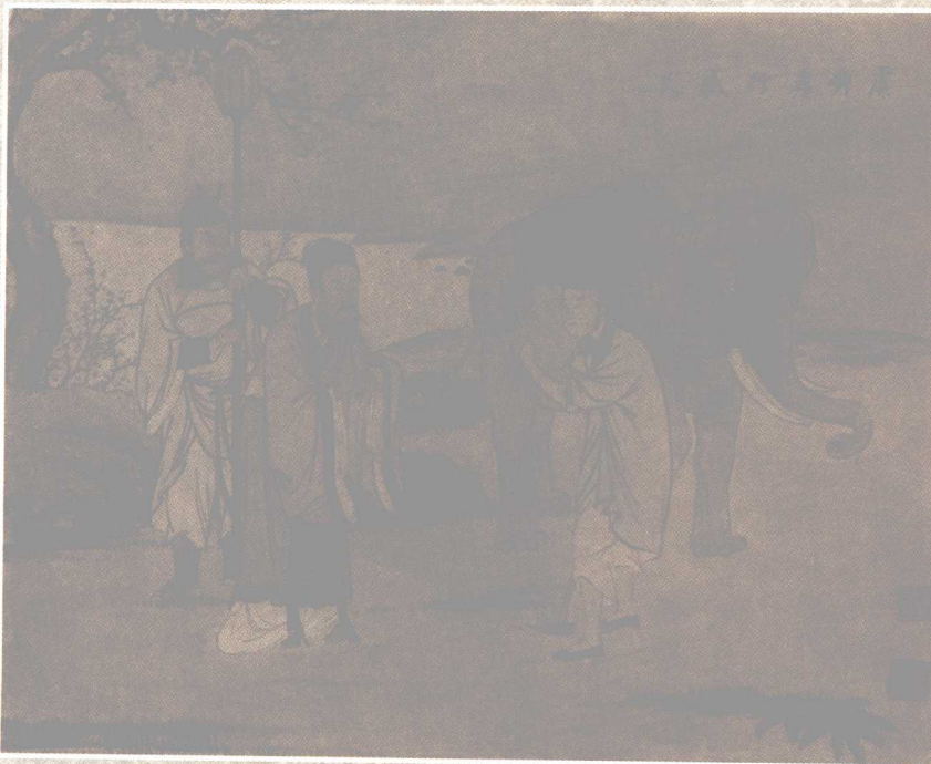
虞舜孝行感天图 清·王素