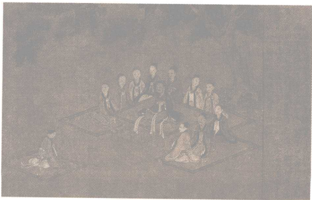
孝经图之开宗明义章 宋·无款

注释：①始于事亲：以侍奉双亲为孝行之始。②中于事君：以为君王效忠、服务为孝行的中级阶段。③终于立身：以建功扬名、光宗耀祖为孝行之终。④《大雅》：《诗经》的一个组成部分，主要是西周官方的音乐诗歌作品。⑤无念：犹言勿忘，不要忘记。尔：你的。祖：祖先。⑥聿修厥德：继承、发扬先祖的美德。聿，语助词。厥，其。以上二句见于《诗经·大雅·文王》。