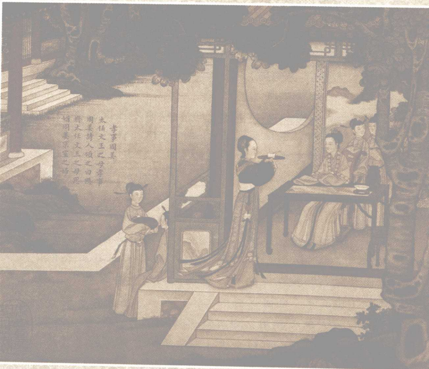
历朝贤后故事图之孝事周姜 清·焦秉贞