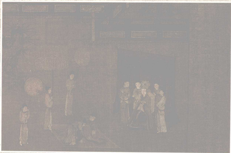
孝经图之天子章 宋·无款