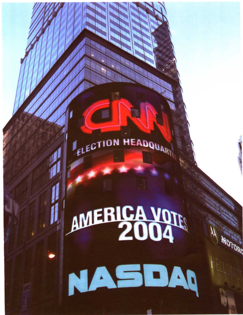
NASDAQ是时代广场重要一景