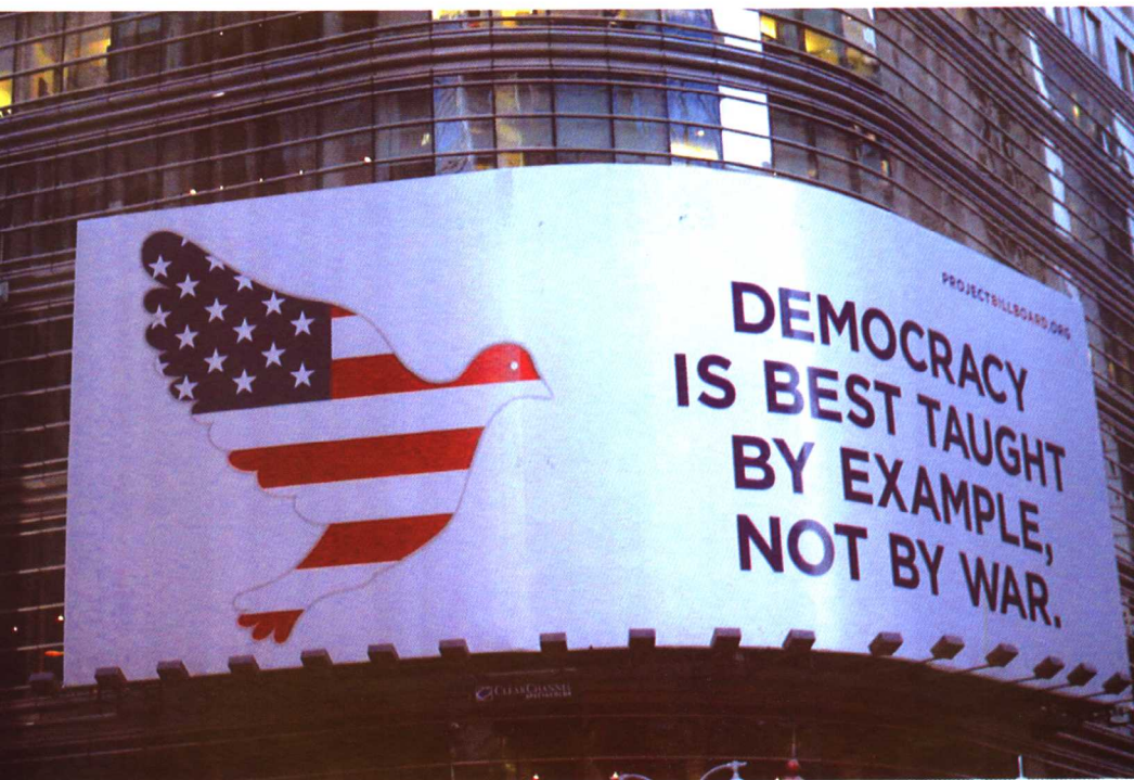
9.11之后，纽约街头一个公益广告： “最好用实例教授民主，而不是用战争。”