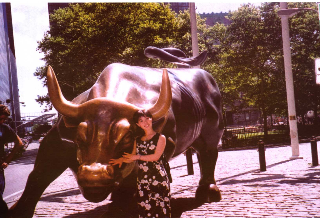
华尔街的这头牛，象征着美国股市牛气冲天