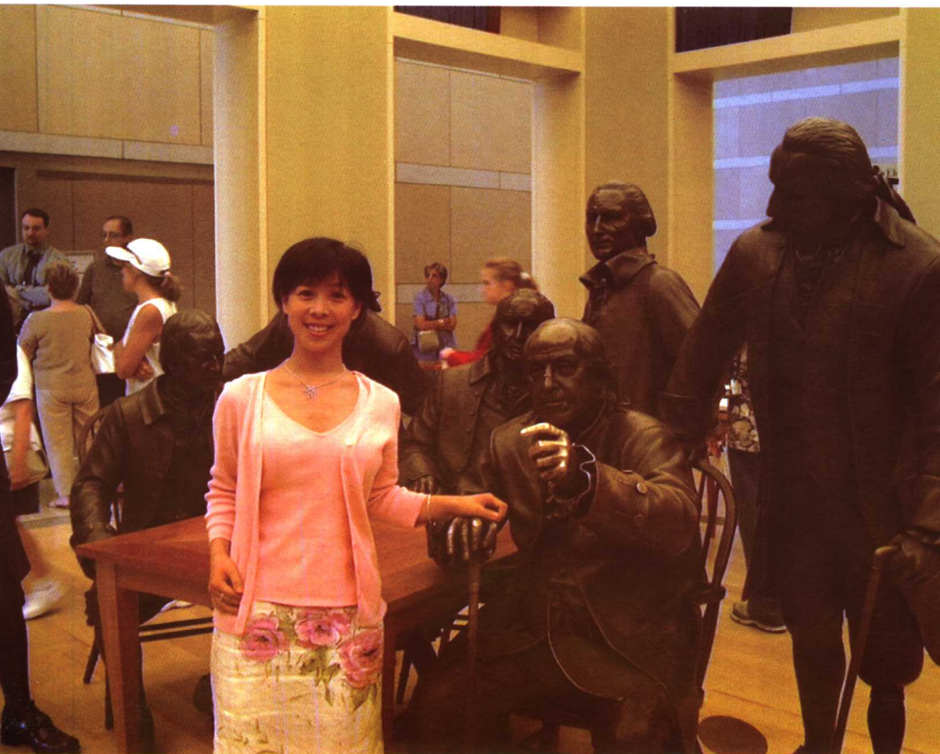
费城的“美国宪法中心”用雕塑生动再现了当年讨论并通过宪法的伟人们