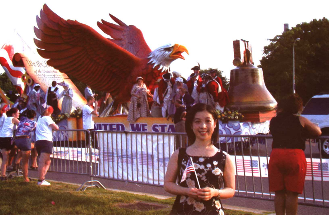
美国国庆游行，彩车上这只展翅飞翔的鹰是美国精神的象征