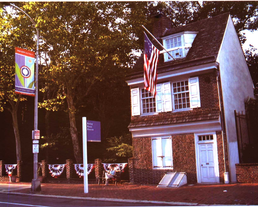
这里是罗斯故居——美国第一面国旗诞生地