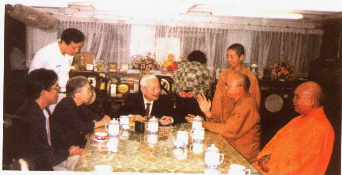
1999年5月27日，正在澳门访问的赵朴初会长与澳门佛教总会初慧、健钊、心慧等法师亲切交谈