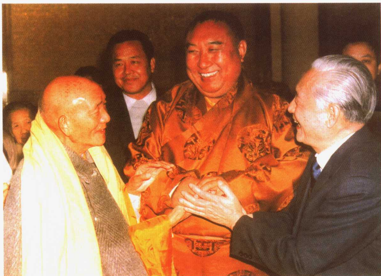
1982年7月，十世班禅大师、赵朴初会长与来访的新加坡佛教总会会长、光明山普觉禅寺住持宏船法师亲切会面