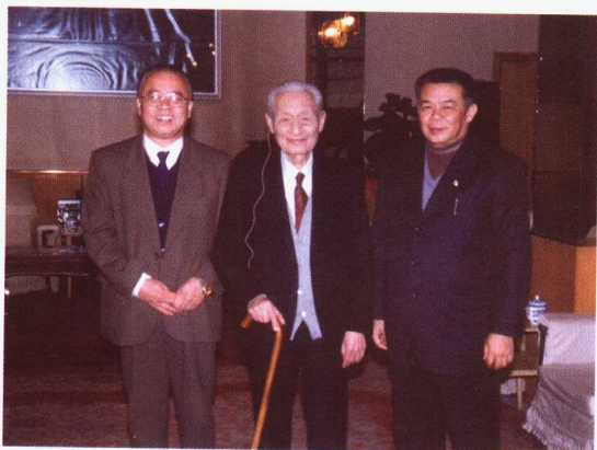
作者与赵朴初会长、刀述仁副会长合影