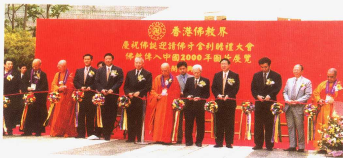
1999年5月22日，香港特别行政区长官董建华，全国政协副主席、中国佛教协会会长赵朴初，国家宗教事务局局长叶小文以及觉光法师、永惺法师、智慧法师等香港佛教界大德、各界知名人士为《佛教传入中国二千年图片展览》剪彩