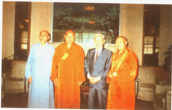
1995年4月1日，赵朴初会长与一诚、安上、昌明法师在广济寺合影