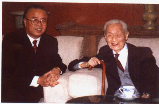
作者与赵朴初会长在中国佛学院合影