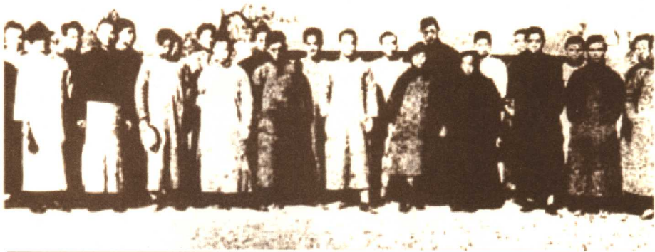
北京马克思学说研究会部分成员合影

职。俄国十月社会主义革命爆发后，他先后发表文章和演说，宣称：“试看将来的环球，必是赤旗的世界！”1919年发表著名的《我的马克思主义观》等几十篇宣传马克思主义的文章。1920年3月，在北京大学发起组织马克思学说研究会；10月发起成立北京共产主义小组。1921年，李大钊和陈独秀致力于建立中国共产党的各项工作，并为党的正式名称定名，从而留下了“南陈北李，相约建党”的佳话。