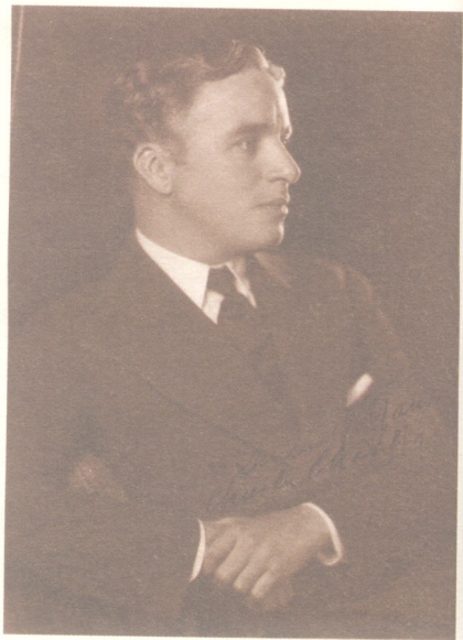
卓别林西装侧面半身照

查理·卓别林出生在英国，少年时代是在英国度过的，其父母都是演员，他从小就受到表演的熏陶。英国具有喜剧传统，其哑剧一直是享有盛誉的。演员所扮演的不是某种抽象的、“一般”倒霉的喜剧人物，而是十分具体的、现实的，在与社会的斗争中接二连三遭到失败的尽人皆知的人。很多观众都可以从这些人物中联想到自己或自己所熟悉的人来。19世纪末，哑剧在游艺场花样繁多的节目中取得了稳固的地位。这要归功于天才的邓·李诺，或者说是“比威尔斯亲王更出风头”的小蒂奇（他是一个矮小的人物，穿一件