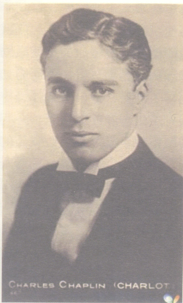
卓别林打领结半身照

精彩的哑剧表演，是使观众发笑的原因之一。查理·卓别林从小便受到哑剧艺术的训练，哑剧艺术的精华贯穿了他一生的表演。那些夸张但清晰而异常准确的手势，那控制自如的面部肌肉，表演上设计精确的重复和强调，情绪上出乎意外的交替变幻，穿插于动作之间的顿歇以及不断变化的速度和节奏，所有这些富于变化的面部表情和动作，即高度的造型修养，构成哑剧演员的基础。