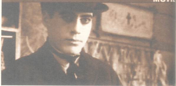
卓别林电影宣传照

些成分大大加以发展。他的名言是：“重要的事就是使观众发笑，那时候他就不再考虑什么了。”塞纳特创建了一套自己的训练方式，培养出很多演员，使他们具备精湛、灵巧的表演技巧，这一点在较大程度上使他的优秀喜剧片成为真正使人发笑的作品。20年来，受过他训练的，有查理·卓别林、福特·斯兜林、罗斯科·阿布克尔、玛倍尔·瑙尔芝、麦克·斯温、本·窦尔平、伯斯特·吉吞、哈里·伦登、格洛里亚·斯汶生、查斯特·康克林等。塞纳特在这方面的贡献，受到了卓别林的高度赞扬。卓别林在《我是怎样取得成功的》一文中写道：“这一事实，即美国最著名的五六十位电影明星都受过他这种独特的训练，表明这种训练具有非常重大意义。凭良心说，有些大明星，他们后来的成功本来应该归功于塞纳特的训练，但是他们对于使自己能够飞黄腾达的人，并没有给予应有的评价。但是所有这些演员，都乐意承认，塞纳特这个人在发掘头等的天才方面，却颇有惊人的嗅觉。”塞纳特的训练，使卓别林在喜剧表演上产生了质的飞跃。具有个性的喜剧人物形象塑造，浓郁的生活气息，使卓别林的人生道路越走越宽阔。