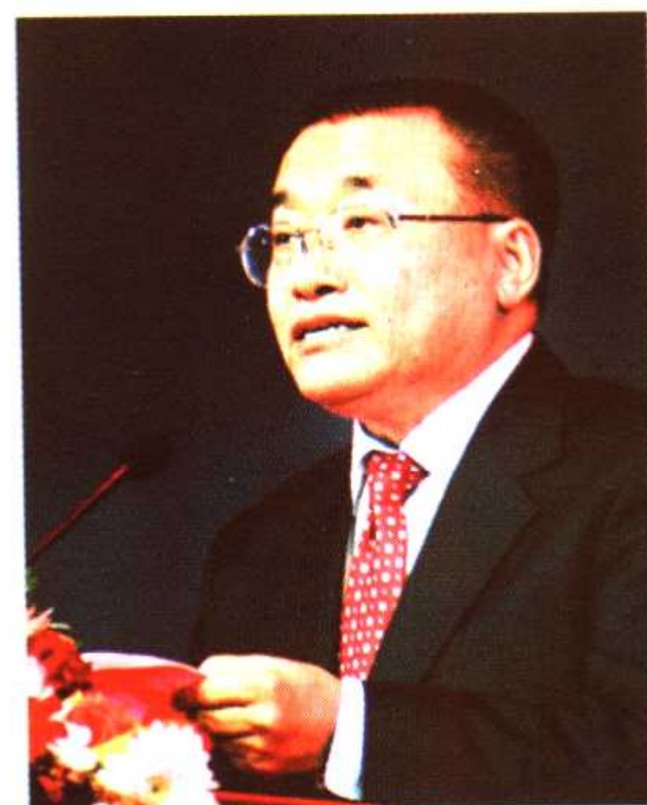
第一届中国诗歌节组委会主任、安徽省省长王金山