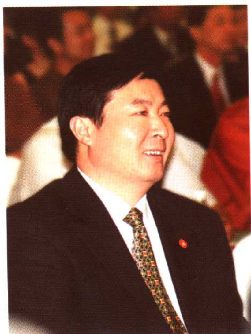
第一届中国诗歌节承办委员会主任、马鞍山市市长姚玉舟