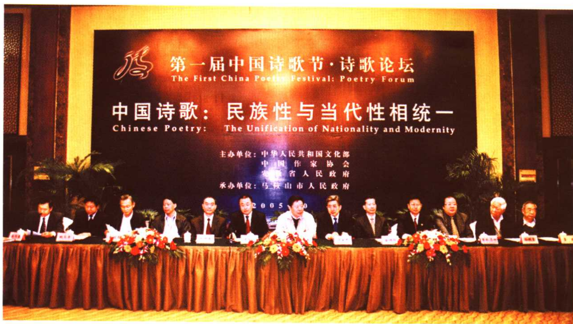
第一届中国诗歌节“诗歌论坛”开幕式主席台（从左至右：张同吾、姚玉舟、朱增泉、黄亚洲、田唯谦、王金山、孙家正、郭金龙、金炳华、丁海中、吉狄马加、孙轶青、李瑛）