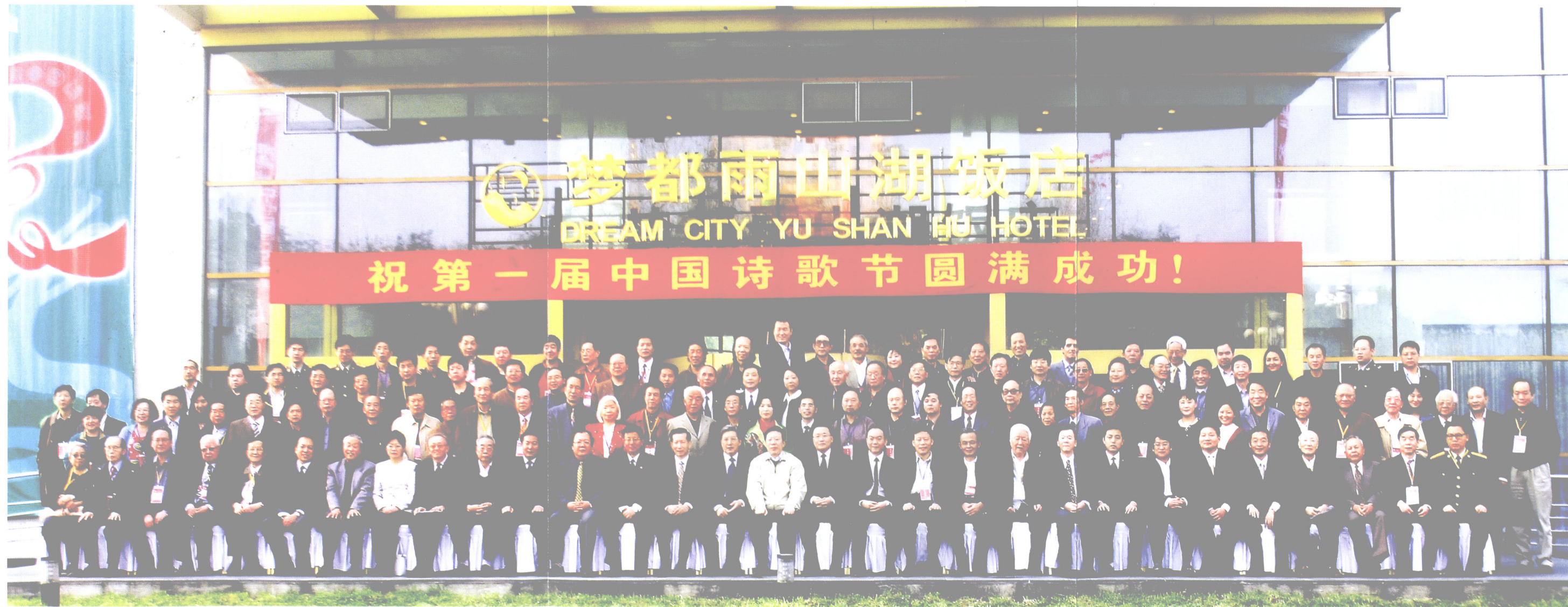
出席中国第一届中国诗歌节的有关领导与全体代表合影