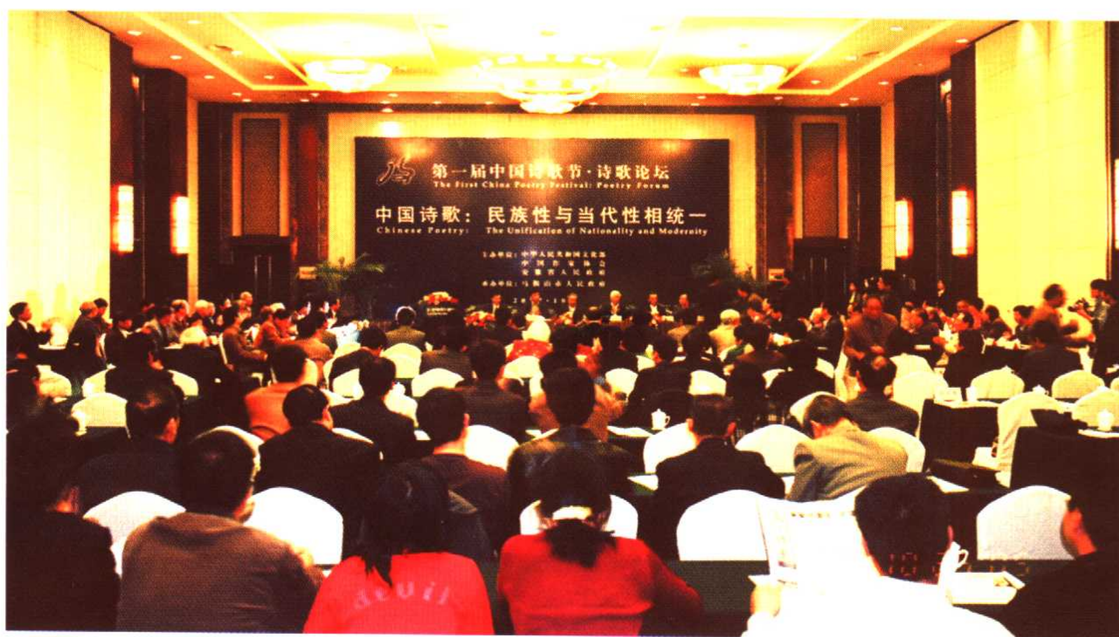
第一届中国诗歌节“诗歌论坛”会场全景