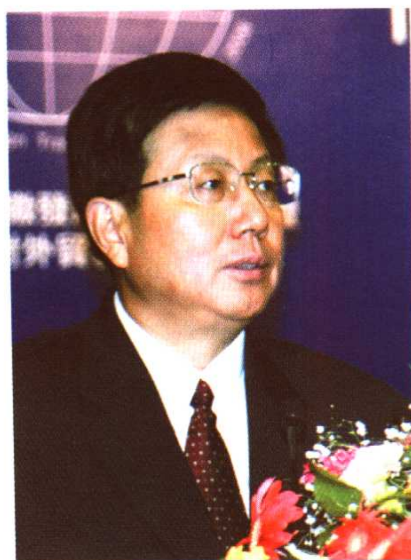
第一届中国诗歌节承办委员会名誉主任、中共马鞍山市委书记丁海中