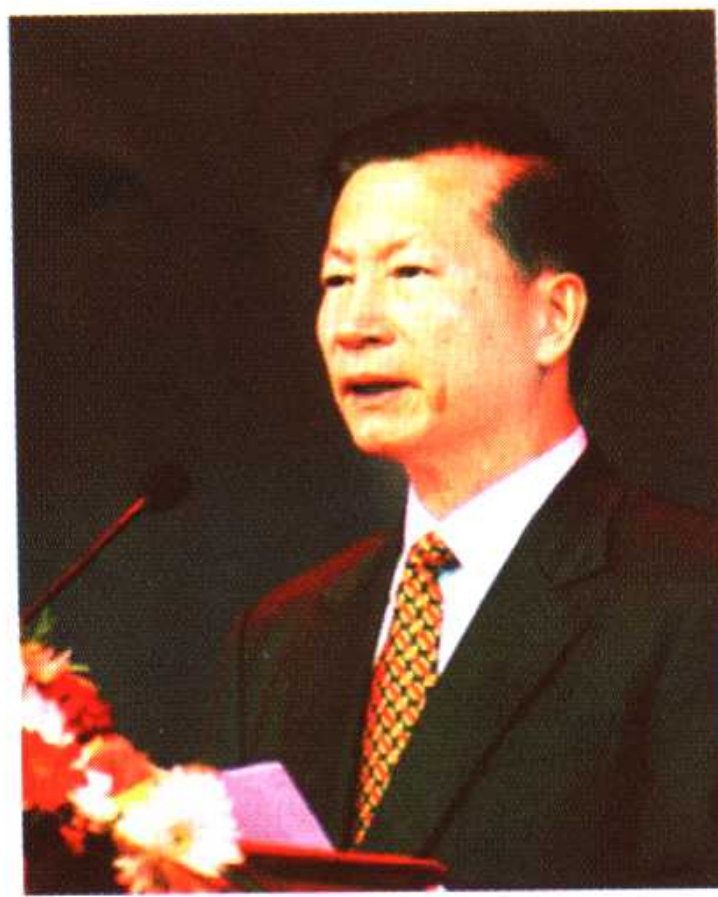
第一届中国诗歌节组委会主任、中国作协党组书记金炳华