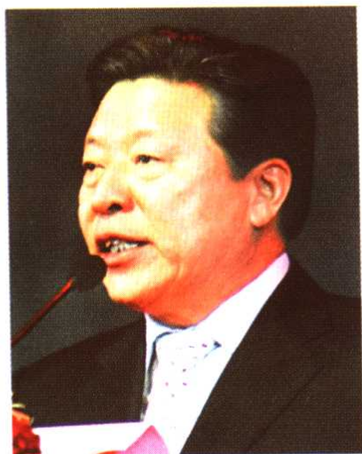
第一届中国诗歌节组委会主任、文化部部长孙家正