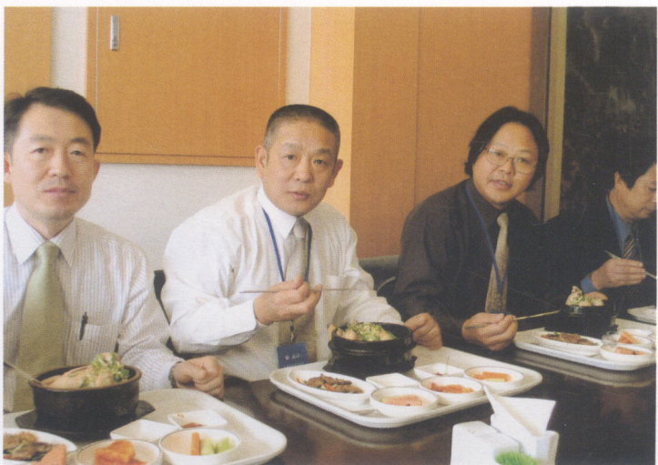
友谊长存——与韩国又松大 学校长签署备忘录（上） 用餐——在韩国（下）

上的点线、墨块亦山亦水、亦草亦木，没有明确的界定，浑浑蒙蒙地被一股气息集结在一起，演奏着天地自然的撼人乐章。张志民在1996年创作的《问道图》、《天道永恒》中有这样的题画：“天道永叵，人道多变，人必应变。适恒方顺天意，若持一不变便成死局，若变而忘恒亦致迷途，然恒变二字又蕴含万