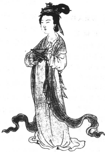
杜牧《杜秋娘诗》诗意图

至于宦官专政,则是直接导致政治黑暗的重要原因。在唐玄宗发动政变消灭韦皇后和太平公主的过程中,宦官起了很大的作用。因此,