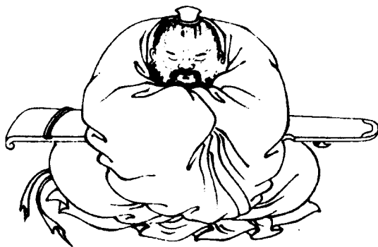
五代宋初著名道 教学者陈抟像

陈抟(871~989),字图南,亳州真源(今安徽亳州市)人,一说西蜀崇龛(今四川安岳)人。一生于《老》、《易》皆有建树,常自号“扶摇子”,以传《易》而闻名,宋人易图(包括龙图、太极图、无极图等)多传自陈抟。此图选自清刻本《历代画像传》。