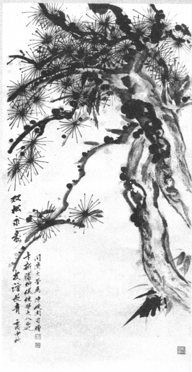
1982年送给德国总统卡斯滕斯的画