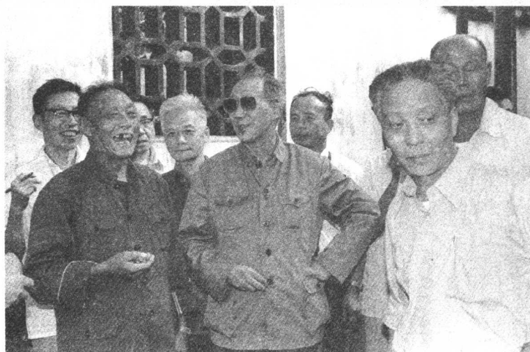
1982 年参加豫园整修会议