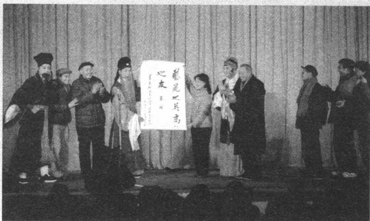
1986年上海昆剧团来同济大学演出后送上题词