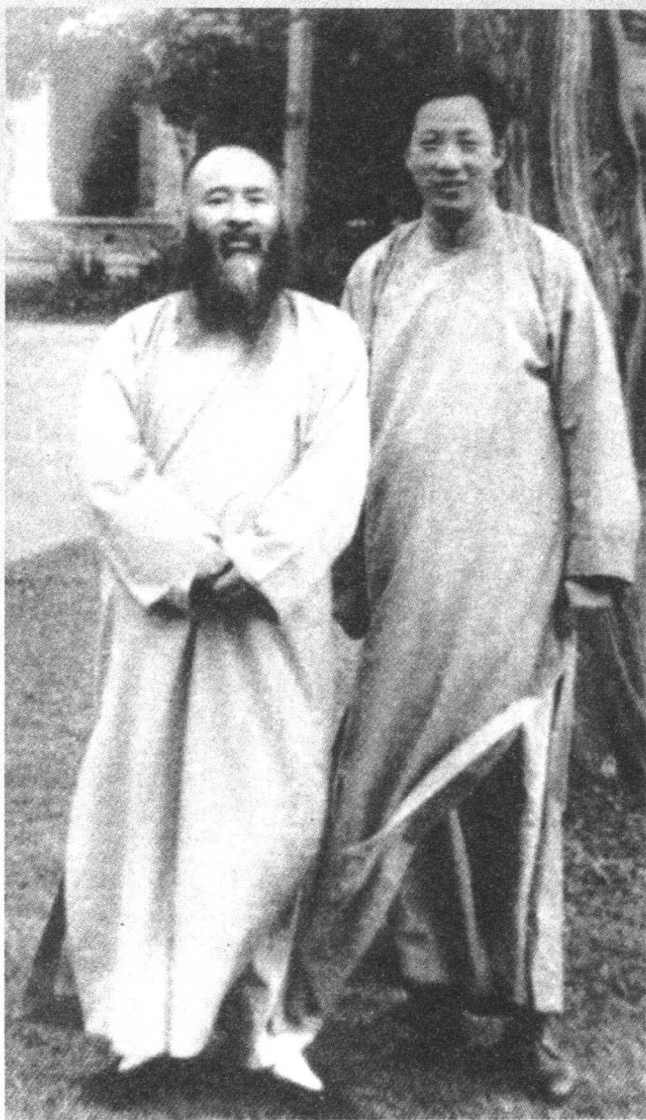
陈从周上个世纪40年代与张大千合影