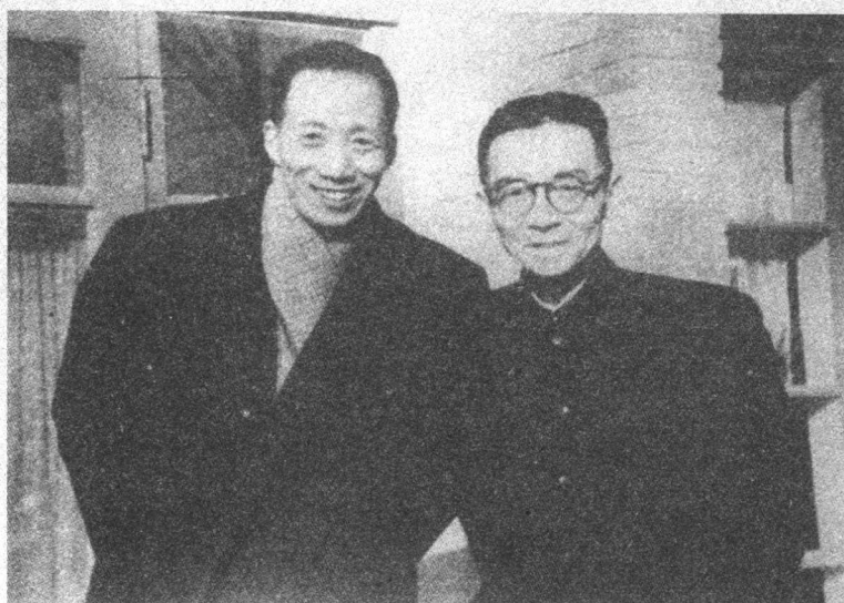
上个世纪 50 年代与梁思成合影