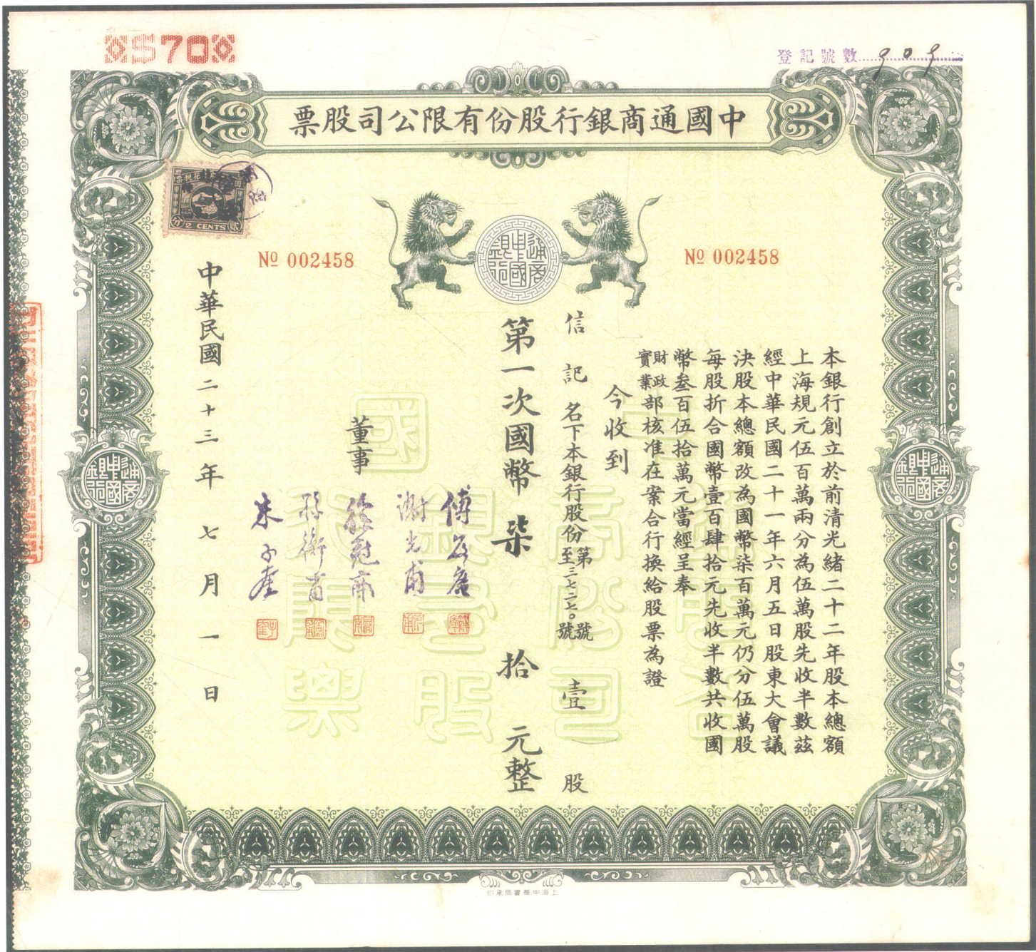
中國通商銀行股份有限公司股票 (票幅 29.7 × 27.5 厘米)