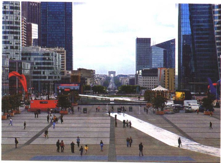
巴黎拉德芳斯新区坐落在凯旋门星形广场的轴线延长线上，连接着城市的历史与未来。

如果说工业化城市建设的核心目标是“经济”的话，未来建设的核心目标就可以说是“文化”。那么未来的城市文化将如何体现呢？在物质文明高度发达的今天，艺术与人们的生活越来越密切，艺术已全面进入日常社会