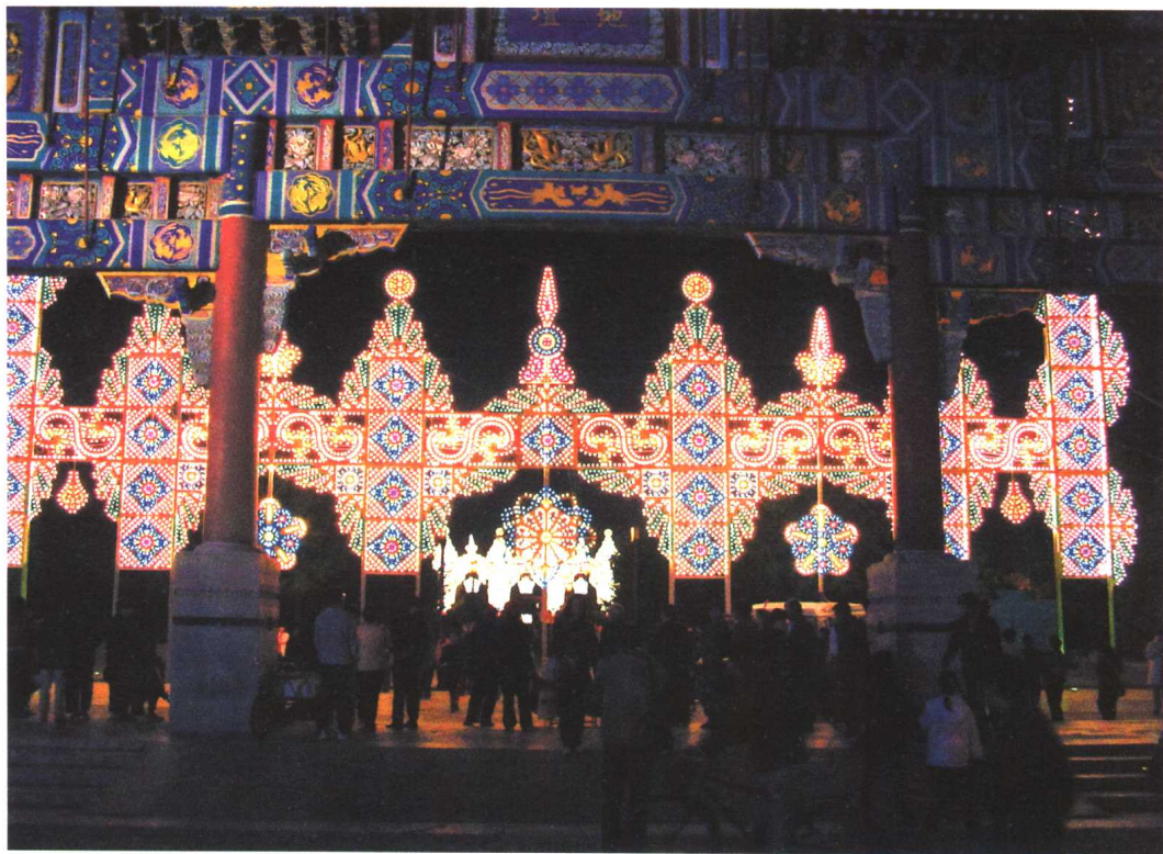
2000年春节北京地坛庙会上意大利艺术家的光雕作品成为节日文化的一部分

城市公共艺术建设的最终目的是为了满足不同城市人群的行为需求,给人们心目中留下一个城市文化的意象。依靠公共艺术可以使城市成为更加多元、立体、个性化和艺术化的综合构成体。