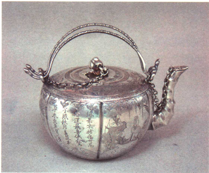
清代纯银制刻花酒壶

此壶制于清宣统元年，做工极其精美考究，为传世品。壶体浑圆，上有平肩，显示平衡高贵，在壶的各部位，以极其精练的手法刻有各种花纹、人物、文字。无论盖、流均精心设计制作，无丝毫不细之处。壶底有“慎”、“桂”字款和银楼字号标志，为皇室所用，极具研究、收藏价值，是清代银器中不可多得的精品。