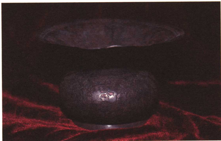
仿唐牡丹花卉扎斗

春秋战国时期是我国银器制造工艺的提高时期，从数量上可以看出当时的制品已相当多样。山东出土过一件战国时期的银匝，上有“越陵夫人”字样；还曾发现一个直径37厘米，高55厘米，重达1705克的大银盘。此盘为直口、平沿、折腹，底微内凹，口沿及内外腹处刻有六组龙凤纹，内底还刻有三条盘龙，口沿下部刻有铭文。银盘制作大气精美，为传世之宝。另外经考证，春秋时期生产了相当数量的银器，广泛分布在中国