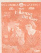
It Happened One Night (1934)