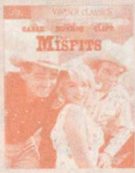
The Misfits (1961)