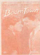
Boom Town (1940)