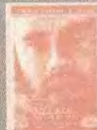
荒岛余生 CAST AWAY (2000)