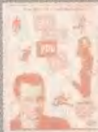
挡不住的奇 迹 THAT THING