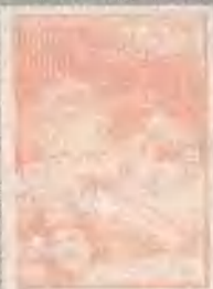
骄阳岁月 A LEAGUE OF THEIR OWN (1992)