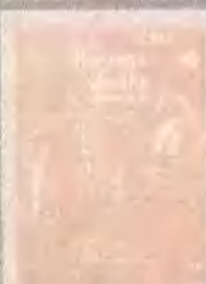
西雅图不眠 夜 SLEEPLESS IN SKATTLE