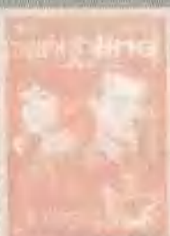
头条新闻 PUNCHLINE (1988)