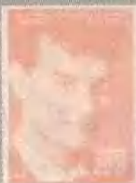
飞向未来 BIG (1988)