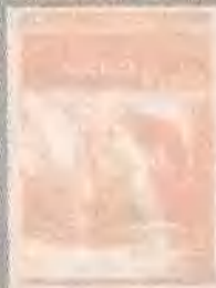
阿波罗 13 号 APOLLO 13 (1995)