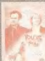
电子情书 YOU'VE GOT MAIL (1998)