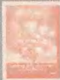
拯救大兵瑞 恩 SAVING PRIVATE RYAN (1998)