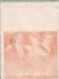
虚荣篝火 THE BONFIRE OF THE VANITIES (1990)