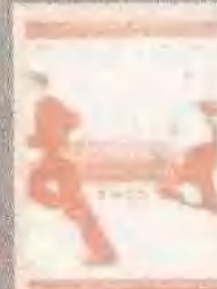
逍遥法外 CATCH ME IF YOU CAN