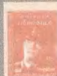
绿色奇迹 THE GREEN MILE