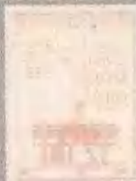
阿甘正传 FORREST GUMP (1994)