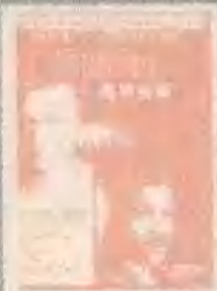
费城故事 PHILA- DELPHIA (1993)