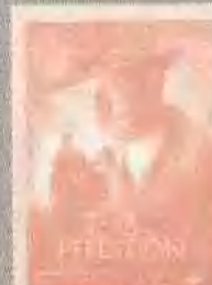
毁灭之路 ROAD TO PERDI- TION