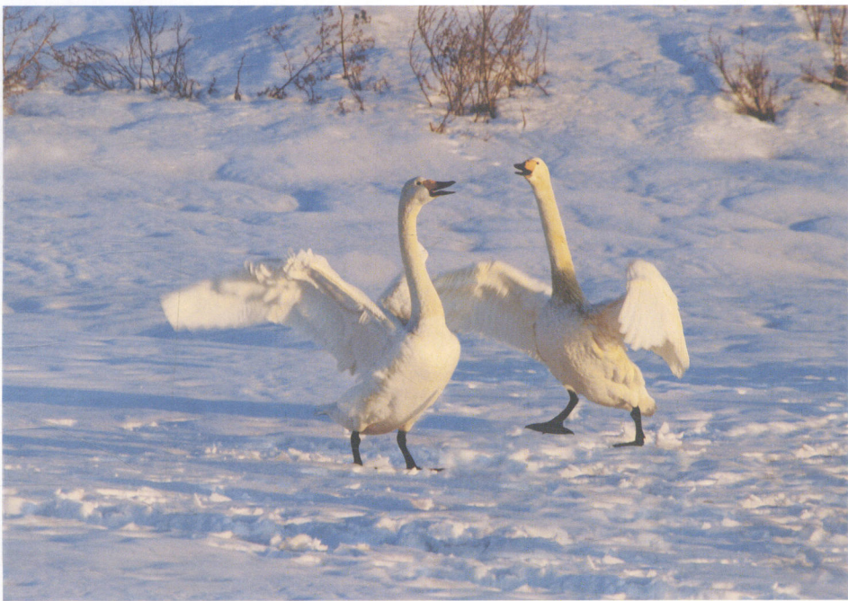
拍摄地点 烟墩角 Shooting Spot Cape Yandunjiao