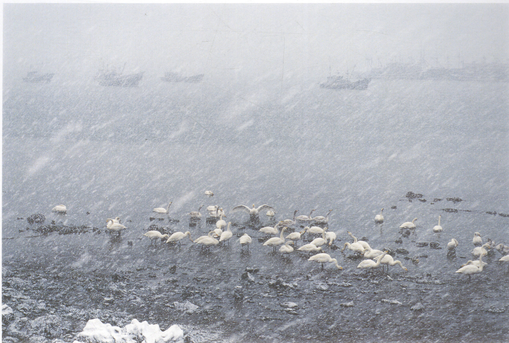
拍摄地点 烟墩角 Shooting Spot Cape Yandunjiao