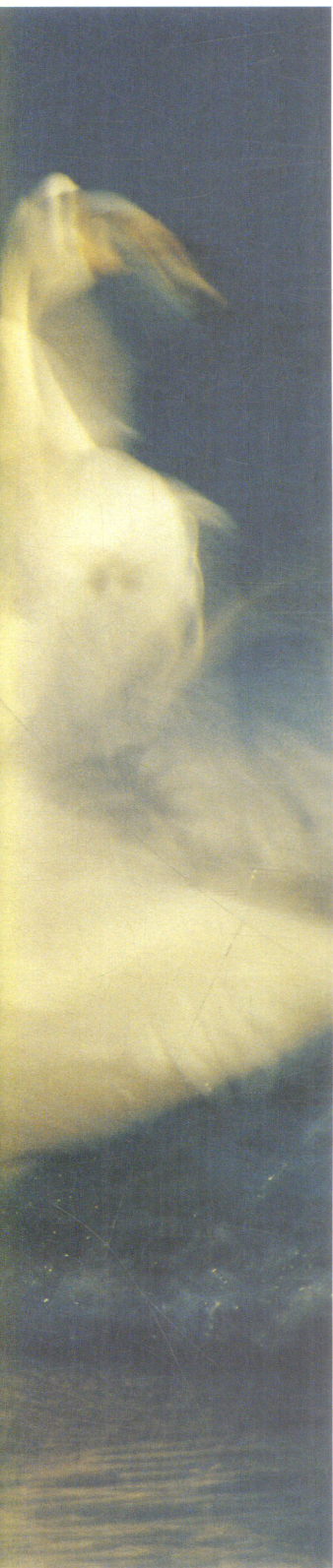
拍摄地点 马山港湾 Shooting Spot Mashan Bay