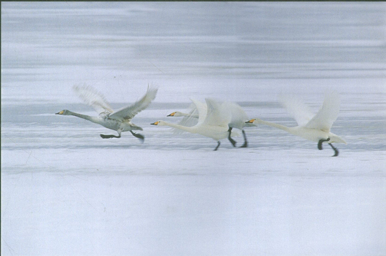
拍摄地点 大瞳水库 Shooting Spot Datuan Reservoir