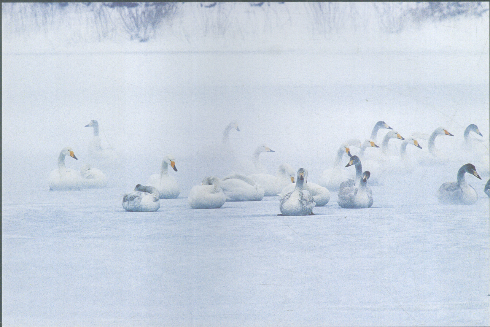
拍摄地点 大疃水库 Shooting Spot Datuan Reservoir