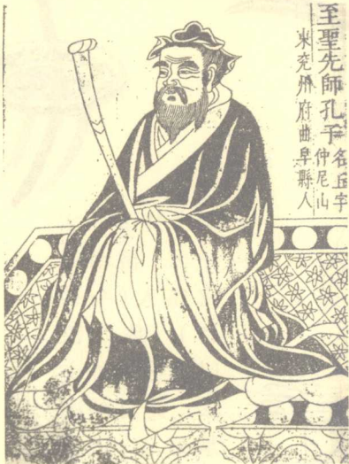
至聖先師孔子 名丘字仲尼 山東省曲阜市 尼山

孔子名丘，字仲尼，兄弟排行第二，所以也有人称之为孔二，春秋后期鲁国人。公元前551年9月28日（夏历八月二十七日）生于鲁国陬邑昌平乡（今山东省曲阜市东南的鲁源村）；公元前479年4月11日（农历二月十一日）逝世，享年72岁，葬于曲阜城北泗水之上，即今日孔林所在地。