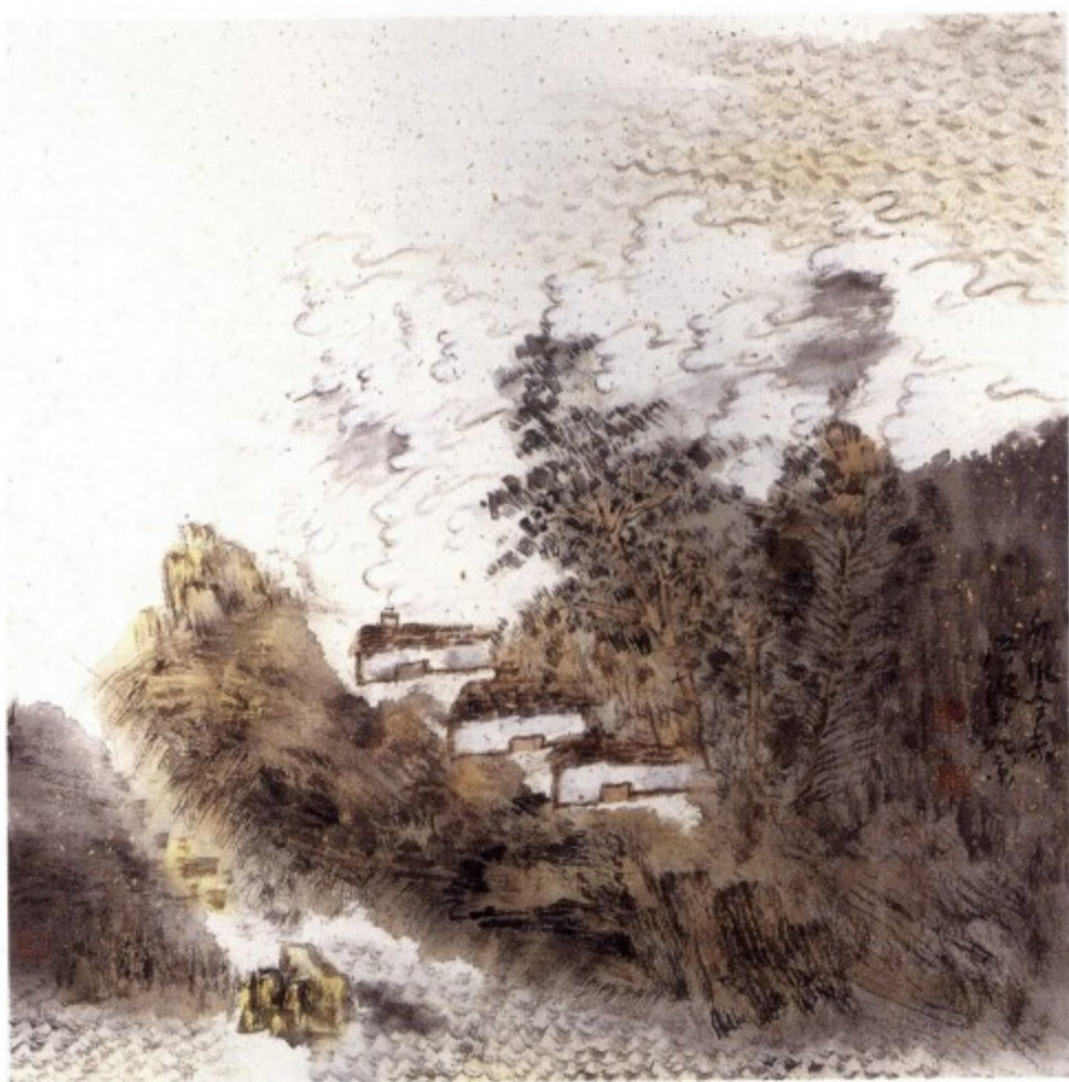
图三 为平远法构图。平远法寂寥空旷,视野开阔,宜表现萧散、平淡、质朴的意趣,云林构图常为之。

在西方绘画中,风景同样也是以三叠两段构图为多。一般近景多坡树、层宇;中景是山崖林木;远景是或浓或淡的远山。中国传统山水画中,如五代、北宋的全景式构图可以叫做二段式,即只有近景与中景或只有近景和远景两部分时,就可以叫做二段式构图。倪云林最擅用此法,在平远的空间里,用干墨在纸上轻擦出简淡的墨痕,只是一段陂陀,几株细细瘦瘦的树,一抹远山,最多再有一个空亭,给人一种荒芜、空寂之感。