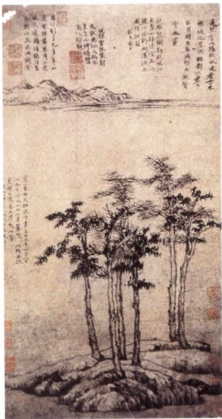
图四 采用传统的三段式构图,近景、中景、远景层次分明,有机结合。