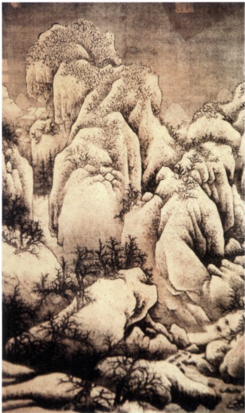
图一 典型的高远法构图。这种方法一般用于近景的表现上，意本表现山势的雄壮、巍峨。