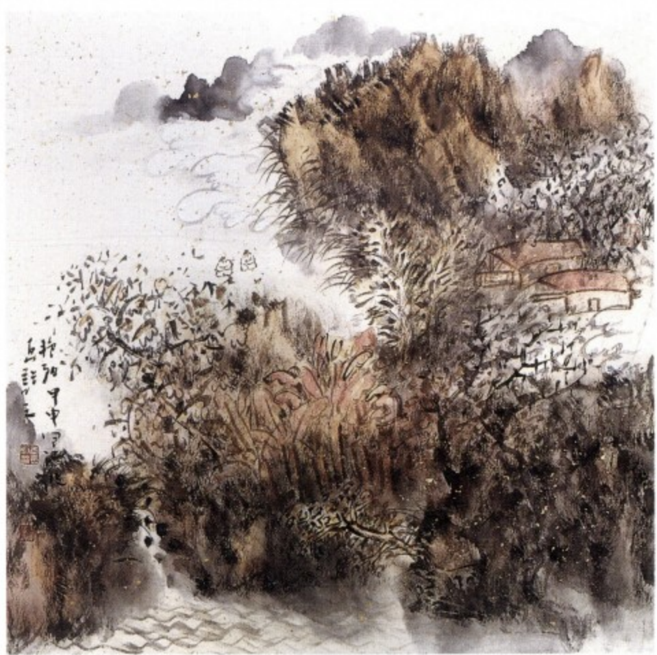
图七 作者借画面一角，描绘了沂蒙山秋高气爽的感受。虽只寥寥一角，却令人回味无穷。

S型构图法是山水画构图的基本程式之一，运用均衡变化的原则，以S型的基本形式造成画面蓄势。弯曲之间的距离和弧度变化、景物的内容和多少，随需要而定。以型的势暗合变化着的景物，S型所形成的韵律节奏在视觉上给人一种柔和婉转、起伏迂回、幽雅流畅的感觉。这种格式所蕴含的形式美的规律是其他格式难以比拟的，另外，还有O型、C型、Y型、T型、Z型的构图格式，乃客观景物所暗合的基本形不同而形成的构图格式。