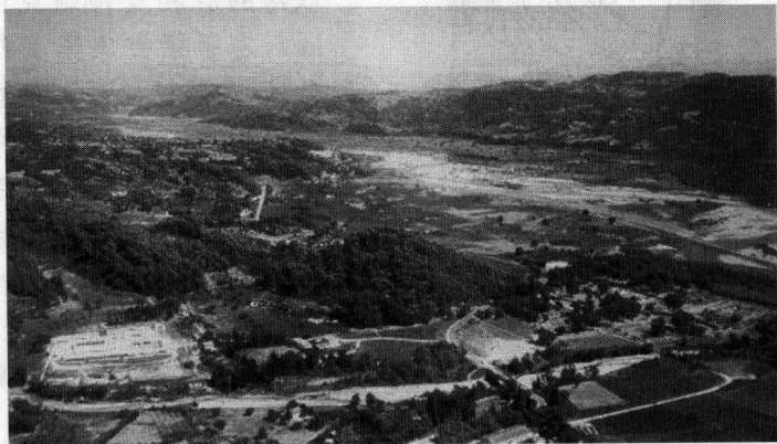
图 1-1 奥林匹亚一角

在希腊的南部坐落着美丽富饶的伯罗奔尼撒(Peloponnesos)半岛(图 1-1),半岛西面的伊利斯(Elis)山谷中有一片神圣的土地,四周山峦起伏,终年松柏苍翠,春来百花争妍,秋季落英缤纷,山间白云缭绕,恍若进入了仙境。这里就是希腊的圣地、奥林匹克运动会的发源地——奥林匹亚(Olympia)。这个半岛也是最著名的希腊荷马史诗中提到的迈锡尼文明的发源地。