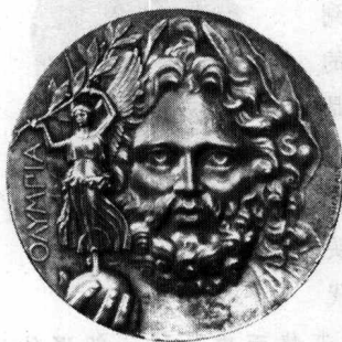
图 1-4 天神宙斯

传说一:在希腊神话中一个广为流传的故事是天神宙斯(图 1-4)大战提坦巨神(Titan)。传说提坦巨神曾经统治万物,居住在阿特利斯山上,宙斯与他的兄弟姐妹们居住在奥林匹斯山,提坦巨神与宙斯曾经进行过一场旷日持久的战争。故事颇为曲折错综,讲的是提坦巨神中一名最年轻的神——克罗诺斯(Cronus),在他母亲大地神的帮助