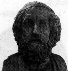
图 1-3 荷马头像

2. 古代希腊伟大的文学作品——荷马史诗: 荷马史诗以其作者的名字命名。荷马(图 1-3)大约生活在公元前 9 世纪到前 8 世纪,是一位双目失明、四处漂泊的吟歌人。“荷马”在希腊语里实际上就是瞎子的意思。他边走边唱,所到之处,将自己的诗歌朗诵给大家听,以此换取食宿。荷马的诗歌无著述,只是通过口头吟唱,他吟诵的诗歌也是根据世代代