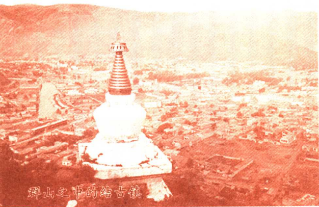
群山之中的结古镇

西藏藏族自治州和玉树藏族自治州的交界线。唐古拉山脉的山体宽达150公里以上,平均海拔在5400米以上,唐古拉山脉的主峰格拉丹冬山峰高达6621米。以格拉丹东为首的雪山群,有33座6000米以上的雪峰。唐古拉山地发育有59条现代冰川。冰川总面积达750多平方公里。其中