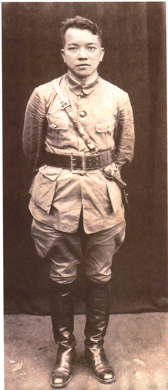
北伐时期兼任国民革命军总参谋长和黄埔军校副校长的李济深。