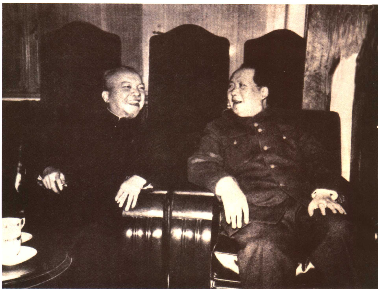
毛泽东和李济深在亲切交谈