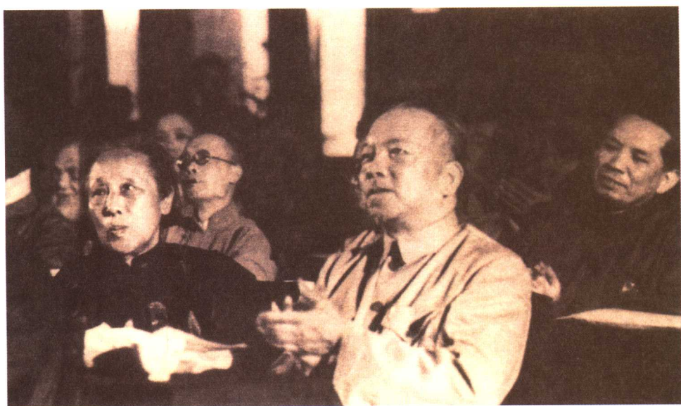
1949年6月15日，李济深（前右）与何香凝（前左）在全国政治协商会议筹备会第一次全体会议开幕式上。