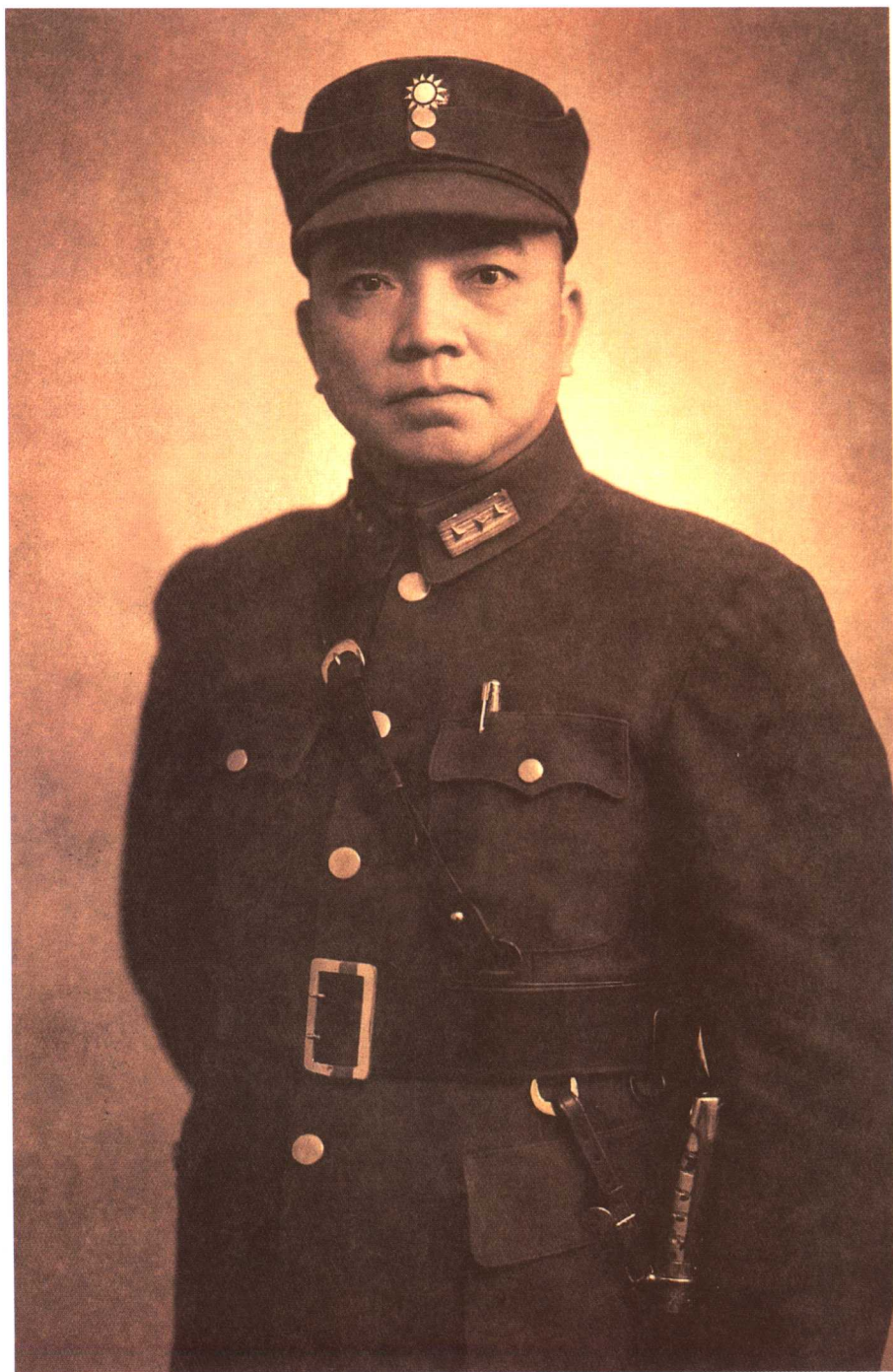
抗战时期任国民党军事委员会桂林办公厅主任的李济深