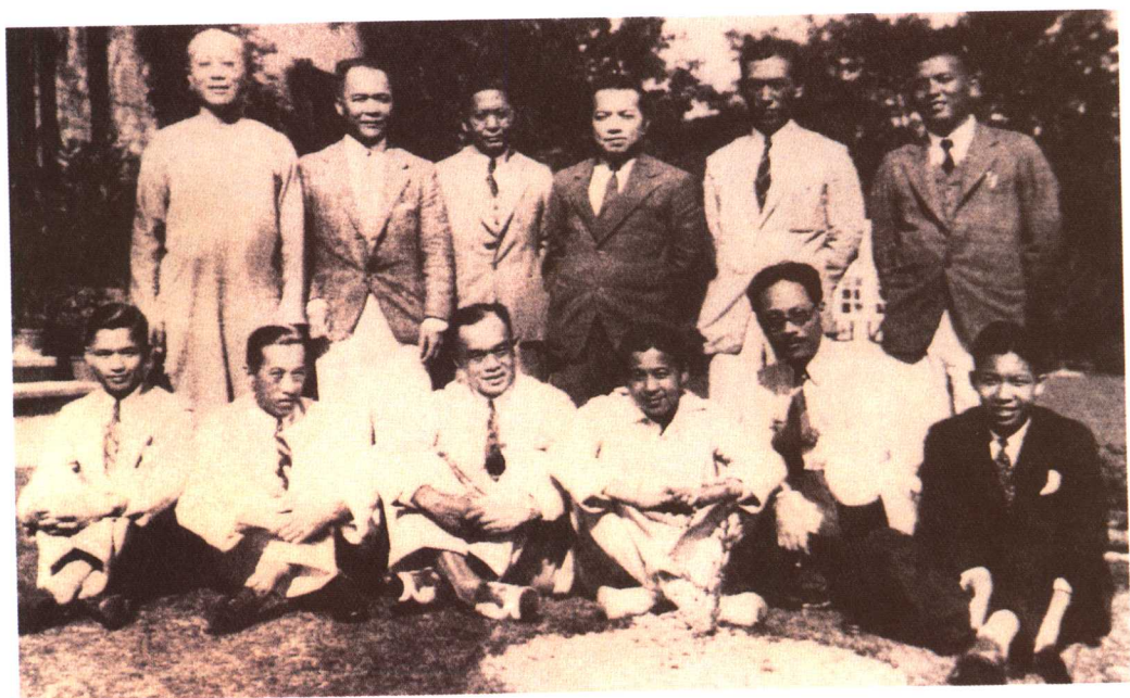
李济深与志同道合的友人们在香港合影留念

1935年7月，李济深为挽救民族危机，继续进行抗日反蒋斗争，与陈铭枢、蒋光鼐、蔡廷锴、宣侠父（中共地下党员）等人，在香港建立了中华民族革命同盟。李济深（左二）任中华民族革命同盟中央委员会主席；宣侠父（左五）任同盟不管部部长。图为他们在香港时合影。