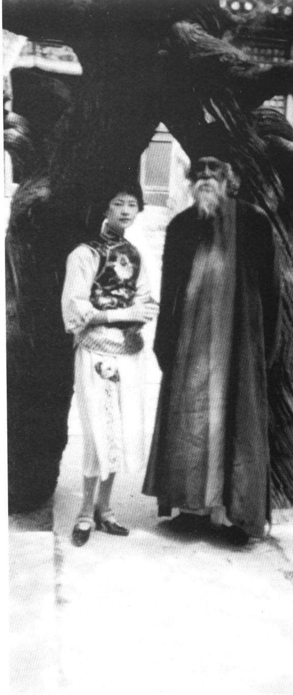
1924年林徽因与泰戈尔