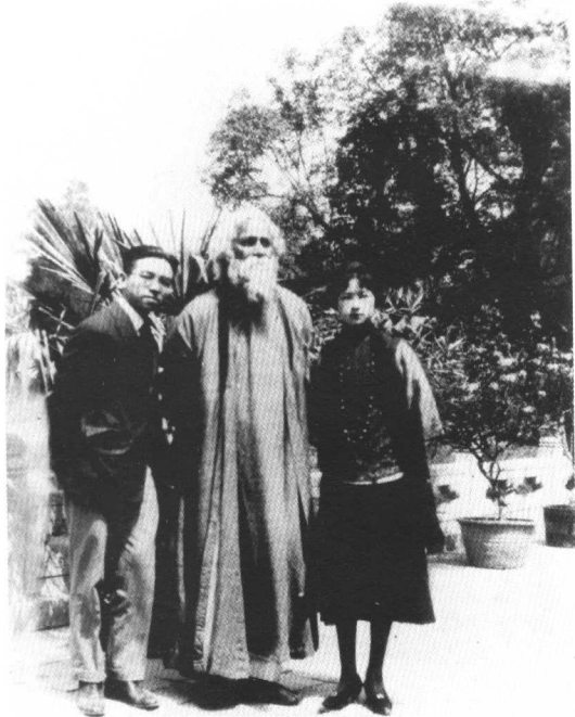
1924年印度诗人泰戈尔访问北平，梁思成和林徽因陪同