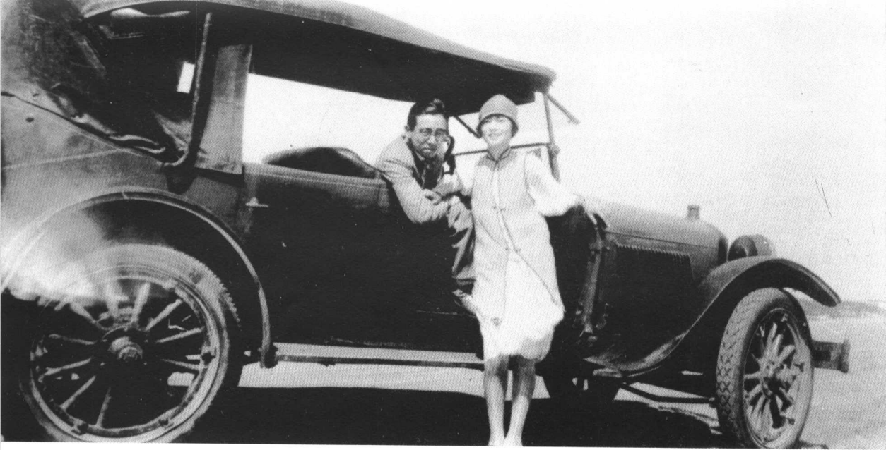
1928 年与梁思成在欧洲度蜜月