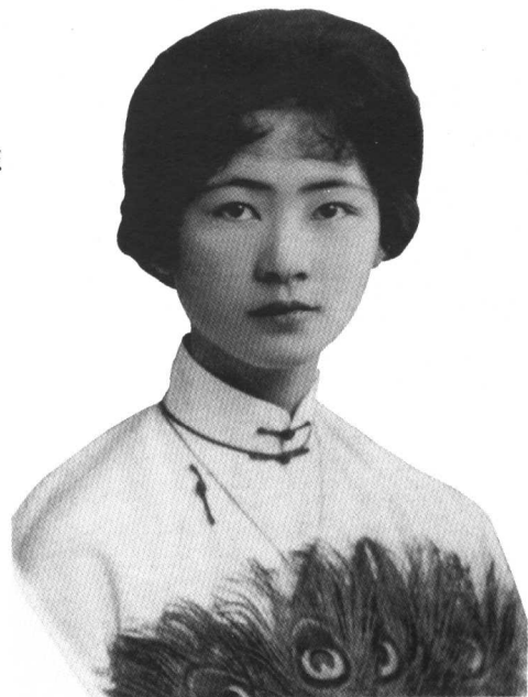
1930 年在国内补照的结婚照