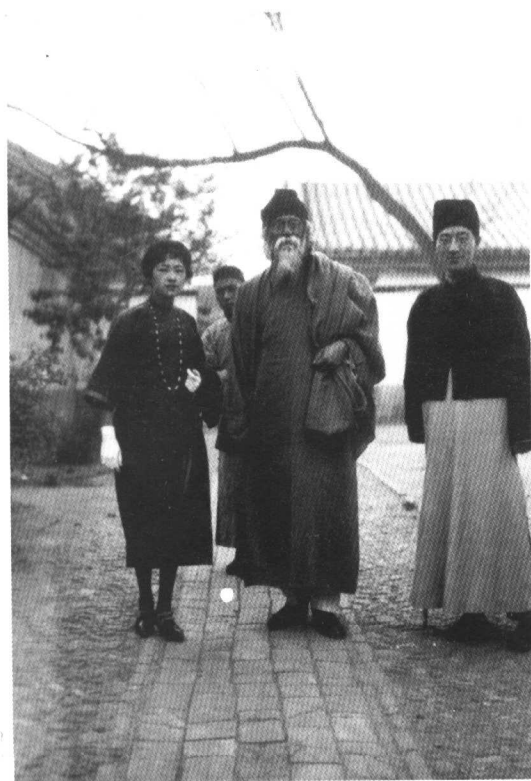
林徽因、徐志摩陪同泰翁