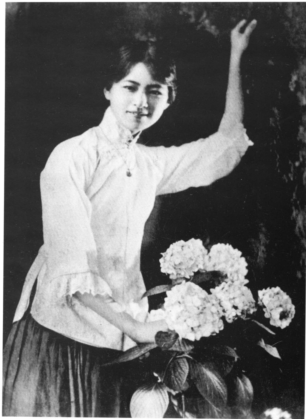
青年时代的林徽因