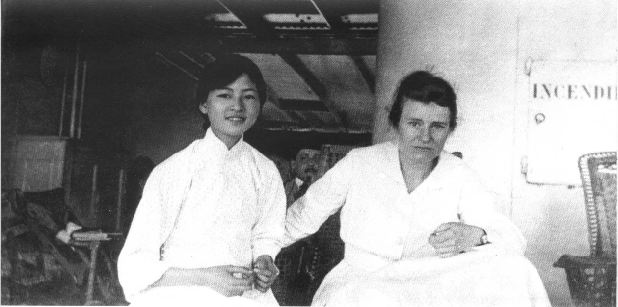
1920年林徽因去欧洲途中与同船旅客合影