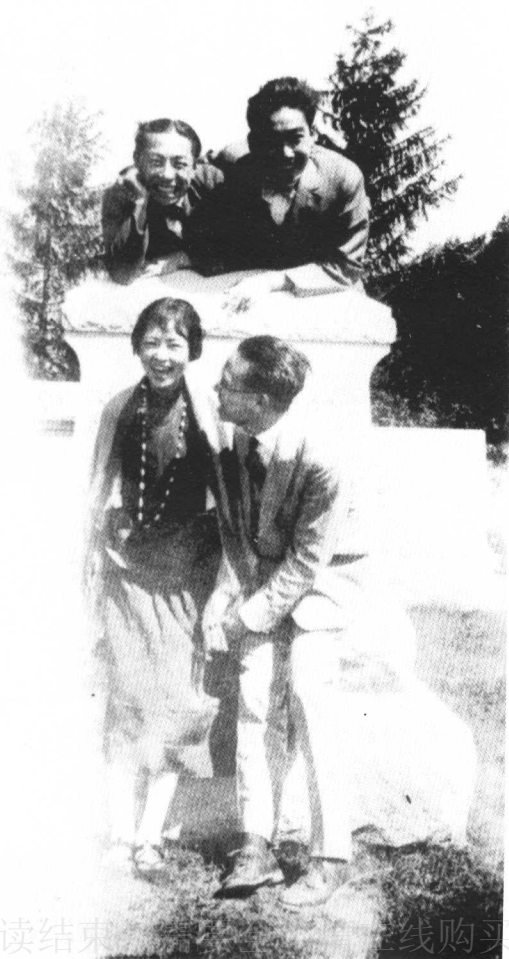
1927 年在宾夕法尼亚大学读书时代的林徽因与梁思成