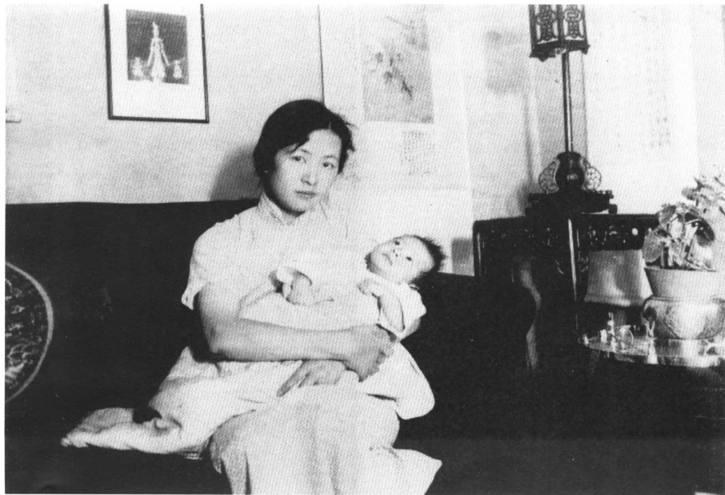
1932年儿子梁从诫刚出生