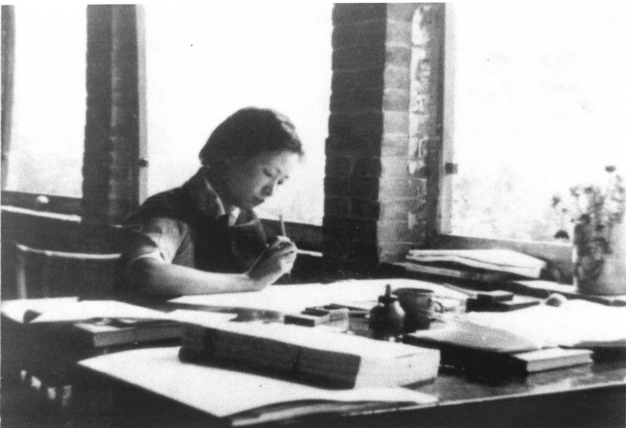
1929 年, 林徽因在沈阳东北大学时