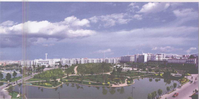
水天相映的庆来公园