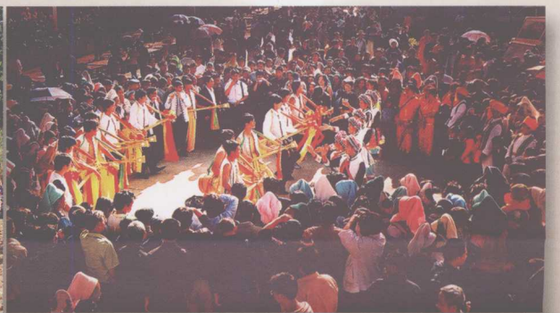
欢乐的旋律