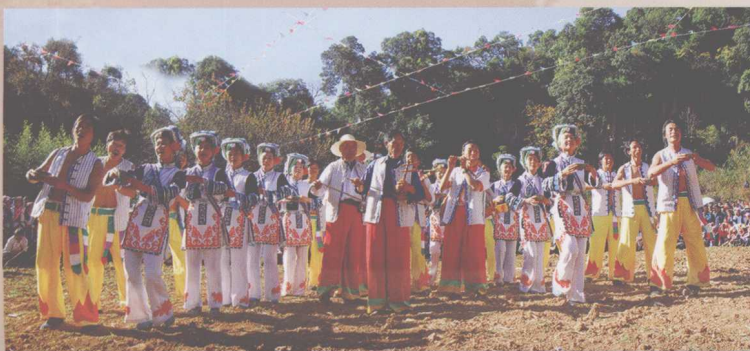
彝家酒歌