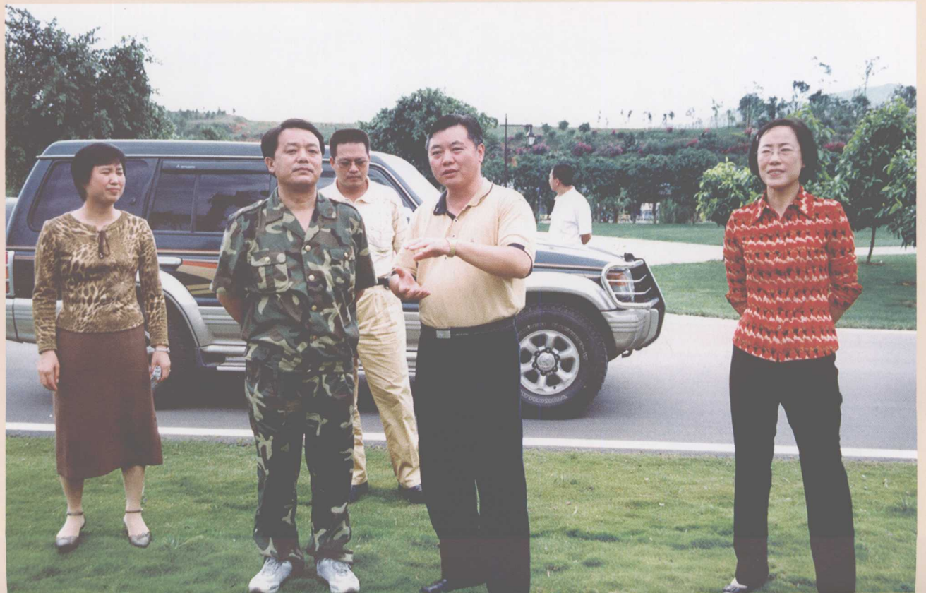
原省长助理现国家民委副主任丹珠昂奔到弥勒调研工作