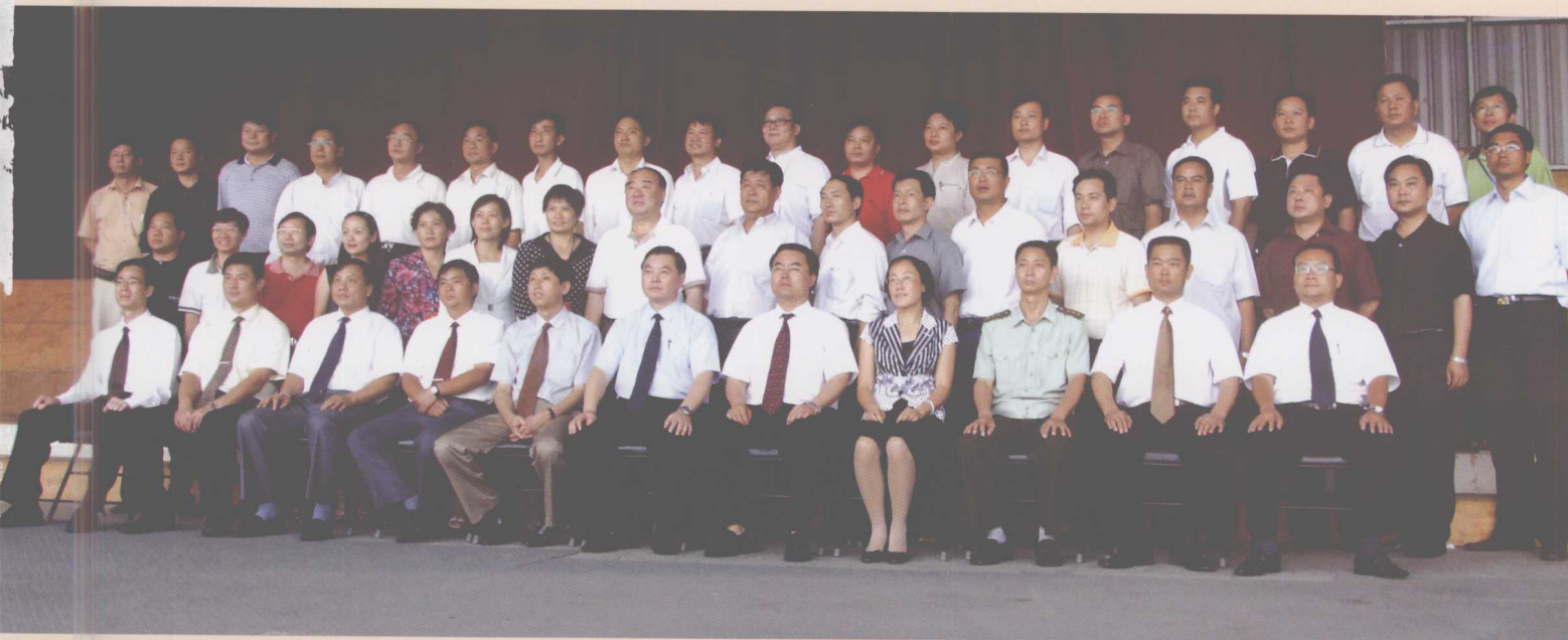
新当选的县委常委领导班子（前排）和委员