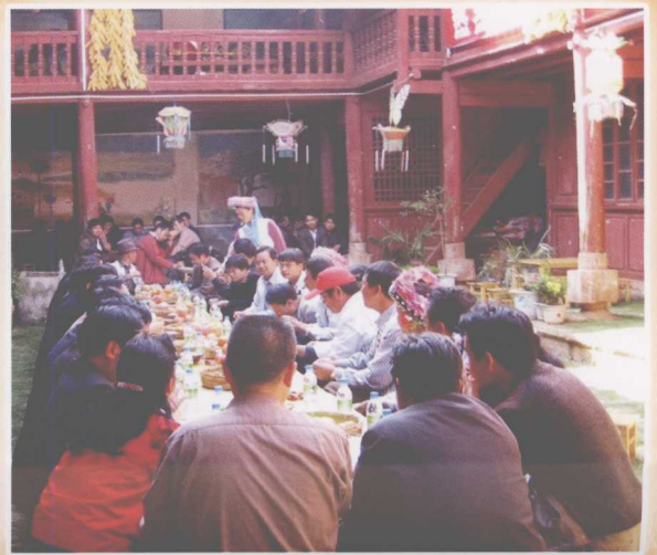
可邑村民族生态旅游