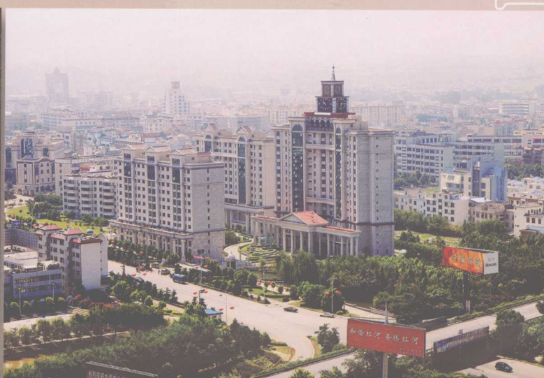
县城新姿