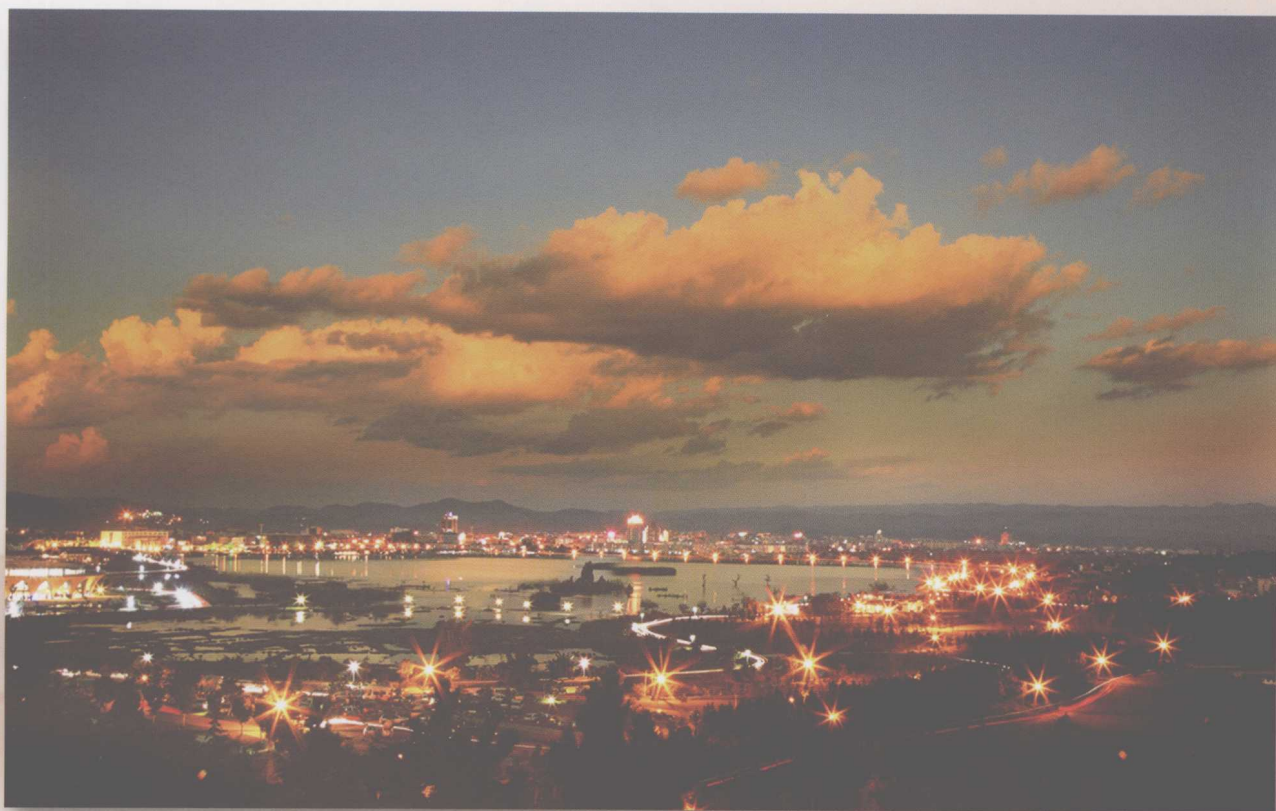
湖泉晚霞