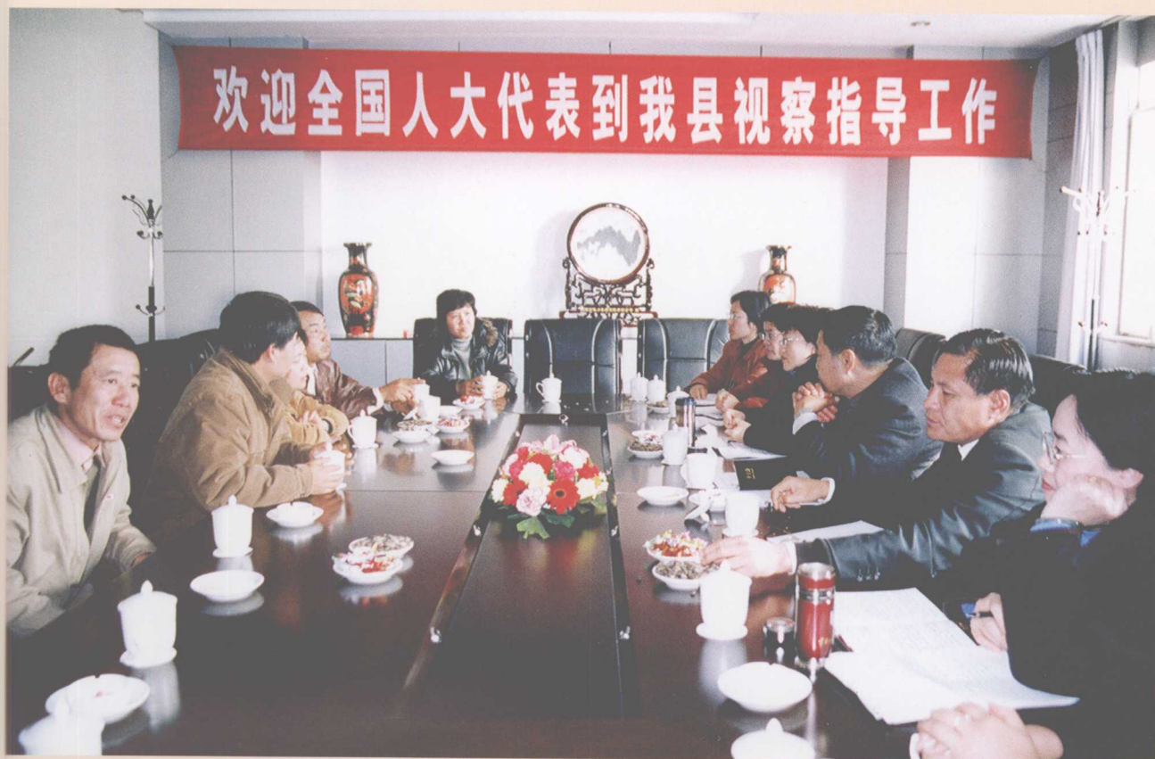
全国人大代表到弥勒视察指导工作