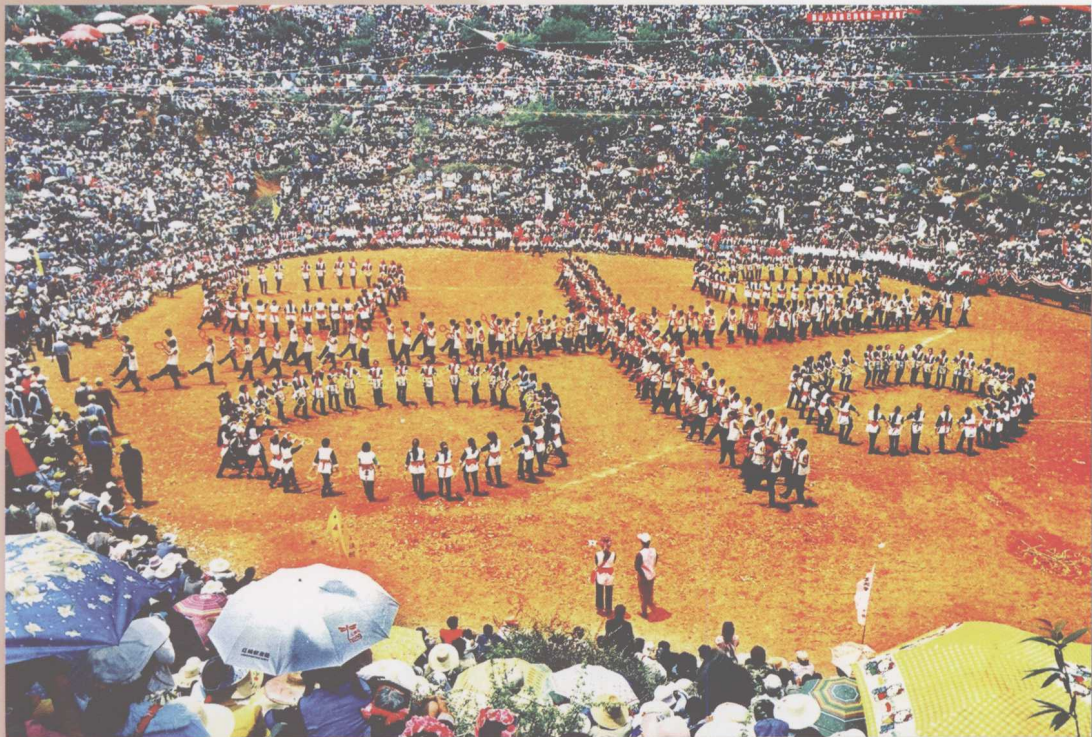
彝乡欢歌