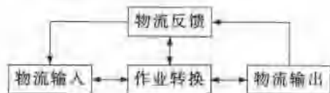
图 1-2 物流系统模型

国际物流系统的一般运作模式如图 1-2 所示,其包括:系统的输入部分、系统的输出部分及将系统输入/输出的转换部分。