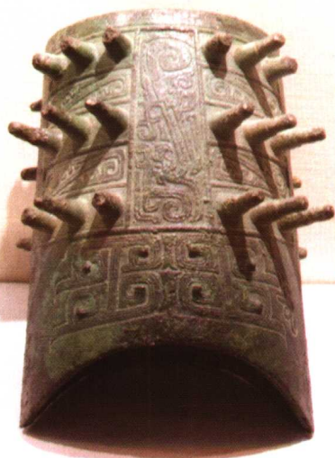
春秋 青铜编钟 蓬莱市村里集遗址出土 登州博物馆藏