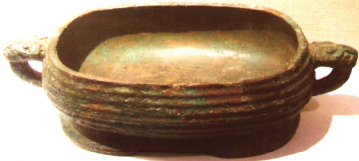
西周 中白盥 登州博物馆藏