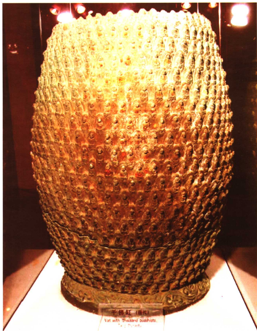
宋 “千佛绕毘卢”莲台铜造像 蓬莱市北沟镇北林寺出土 登州博物馆藏