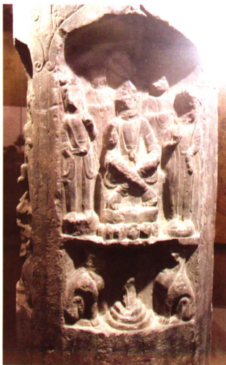
隋 开皇五年(585)王俱造像(局部) 传蓬莱市安香寺村出土 登州博物馆藏