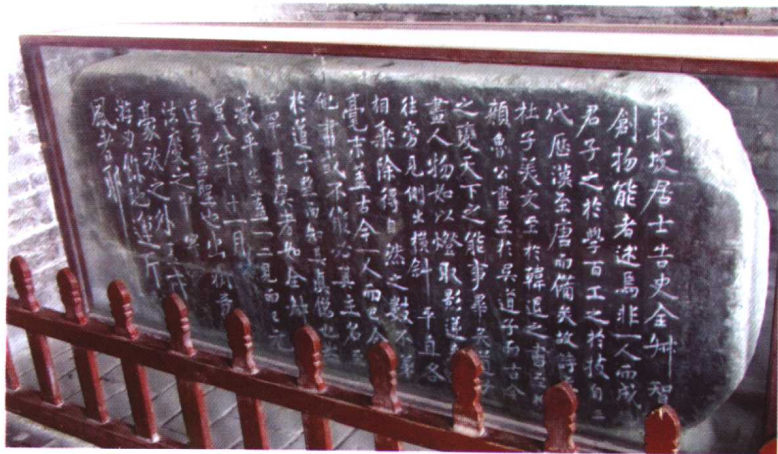
金 苏轼《题吴道子画后》 碑阴为楷书《海市诗》 现藏蓬萊閣蘇公祠