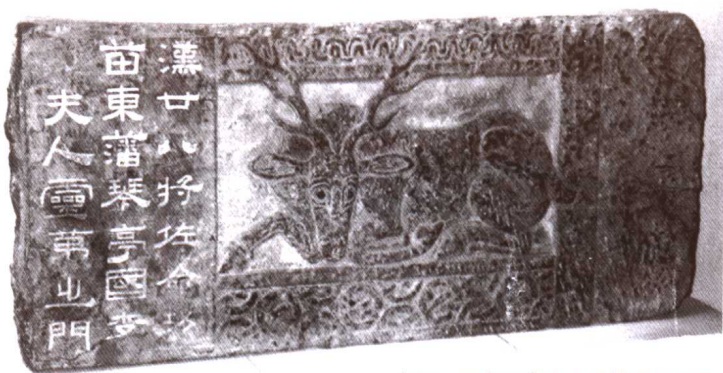
东汉 琴亭国李夫人灵第题记原石 登州博物馆藏