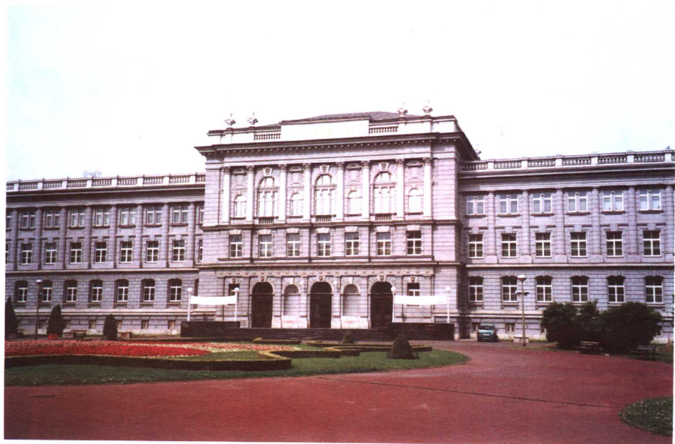
收藏有古代中国文物的米马拉博物馆（萨格勒布）