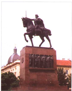
托米斯拉夫国王雕像