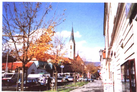
萨格勒布城市一瞥