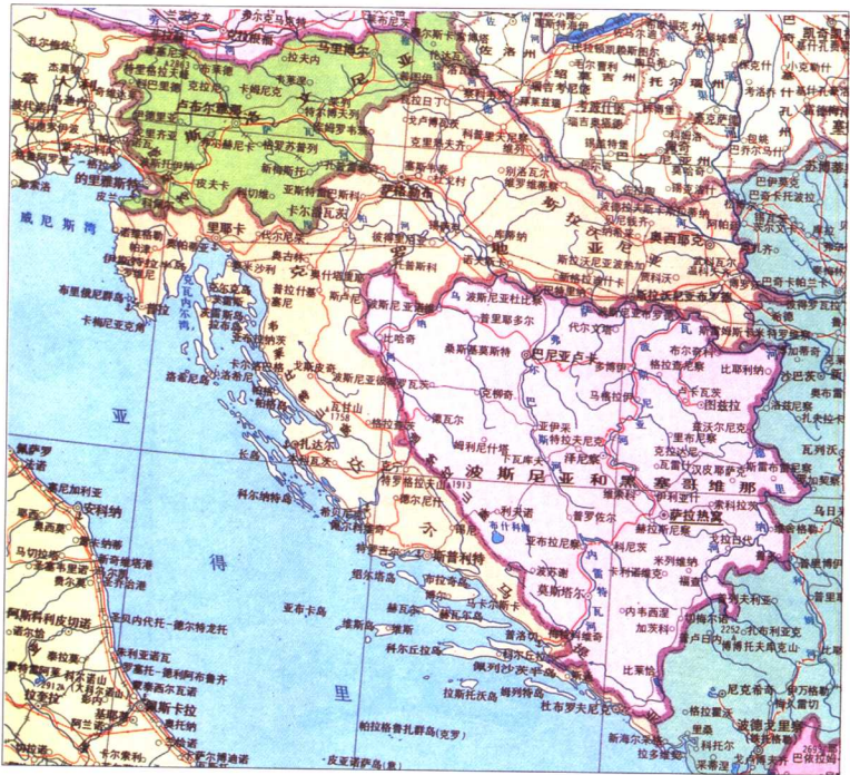
克罗地亚行政区划图