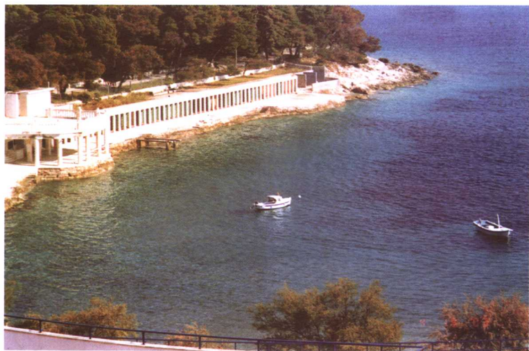
布里俄尼群岛海滨