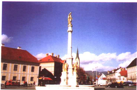
卡帕托尔 (萨格勒布市)