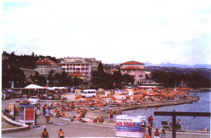
奥帕蒂亚海滨浴场