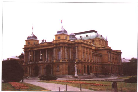
克罗地亚国家歌剧院