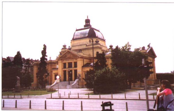
克罗地亚艺术展览馆