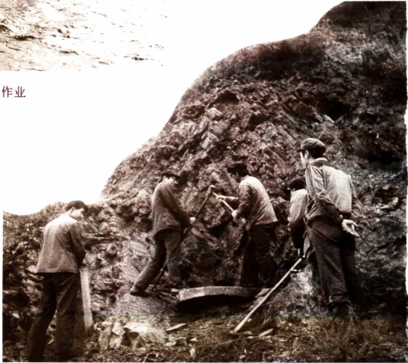
测绘队员埋设测量标志