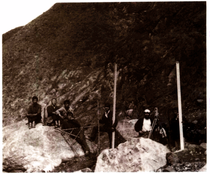
测绘队员野外小憩