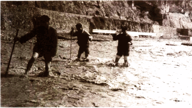
测绘队员涉水作业