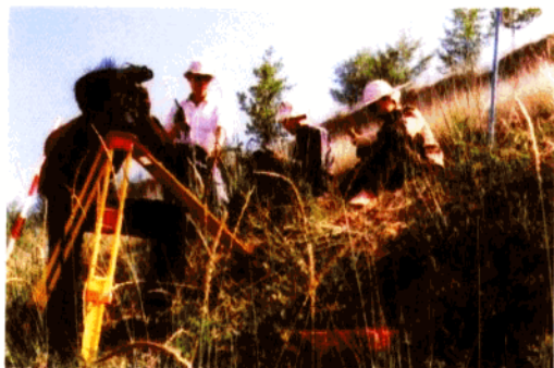
测绘队员野外作业

《金城揽胜图》选自兰州市城乡建设委员会编纂、1989年出版的《兰州城建画册》。本图以工笔画的方法、山水画的形式，详细地表现了各种地理要素及人文要素。这标志着清时以工笔画方法绘制地图的技术已达到了相当高的水平