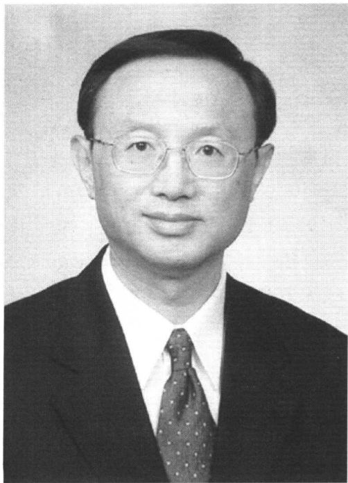
杨洁篪在美国有“老虎杨”（Tiger Yang）之称

这天上午10时30分，中国外长杨洁篪要与加拿大外长彼得·麦凯举行会谈。10点刚过，众多记者就聚集在大厅内，“长枪短炮”也都早早架起，准备一览杨洁篪这位新