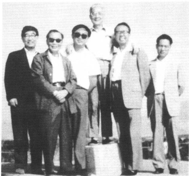
杨洁篪（左三）和章文晋大使（右三）在希腊马拉松起点

十点半，着深灰色西装、系红条纹领带的杨洁篪准时地出现在橄榄厅，在工作人员的陪同下，他满面春风地上前迎接刚刚走进大门的麦凯先生，如同已是多年老友一般，两国外长用英文寒暄着，一