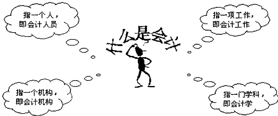
图 1-1 关于会计的对话

甲、乙、丙、丁是四个好伙伴,在一次聚会上,一通天南海北之后,聊起了什么是会计这一话题,四人各执一词,谁也说服不了谁。