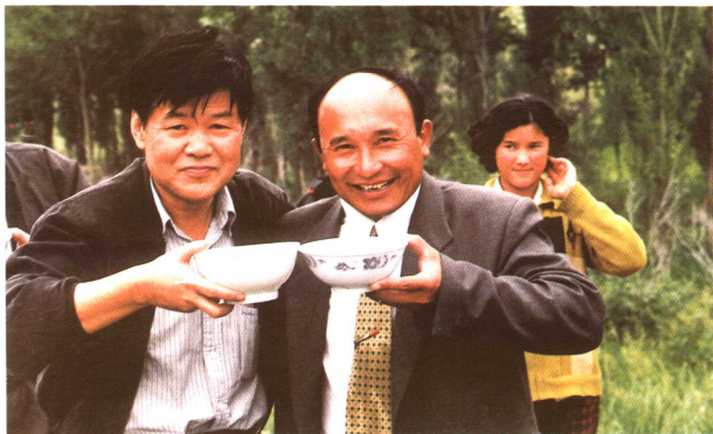
▲ 2000年至新疆采风，与哈族副县长喝送行的马奶子酒。