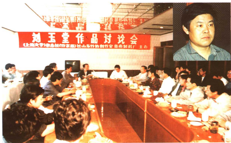
▲ 1993年，我的作品讨论会上，诚惶诚恐！