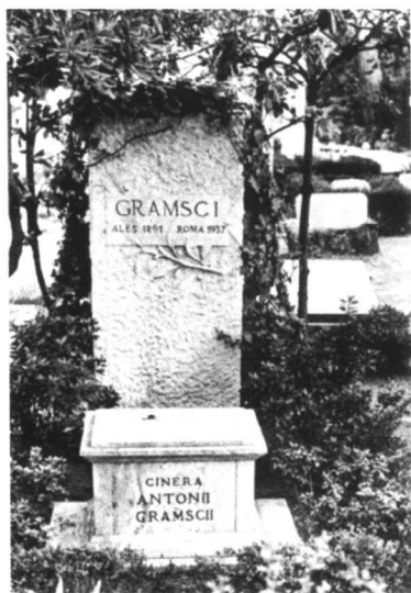
葛兰西墓(罗马,英国公墓)