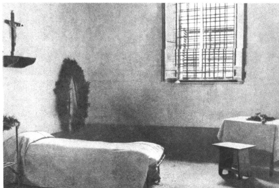
葛兰西牢房(杜里监狱)