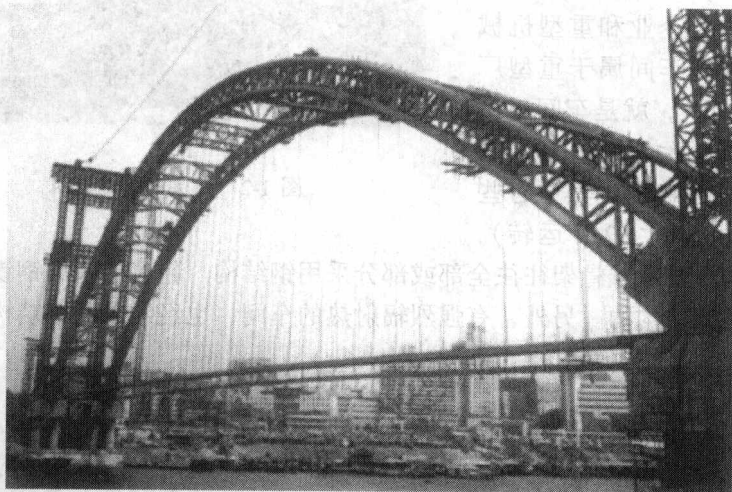
图 1-5 钢拱桥