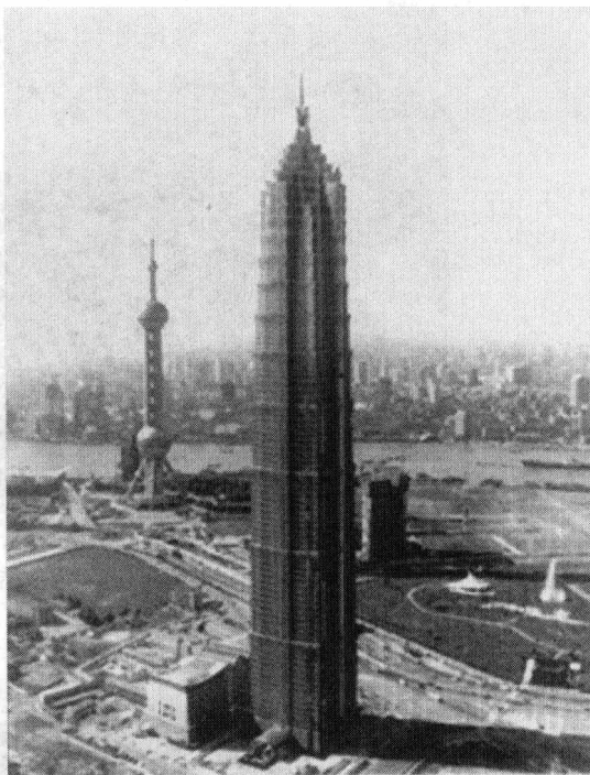
图 1-2 高层钢结构建筑

这些车间的主要承重骨架往往全部或部分采用钢结构。新建的宝山钢铁公司，主要厂房都是钢结构的。另外，有强烈辐射热的车间，也经常采用钢结构。