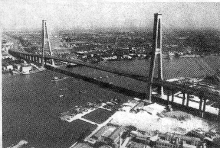
图 1-3 斜拉桥