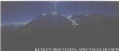
KUNLUN MOUNTAINS—SPECTACULAR VIEW