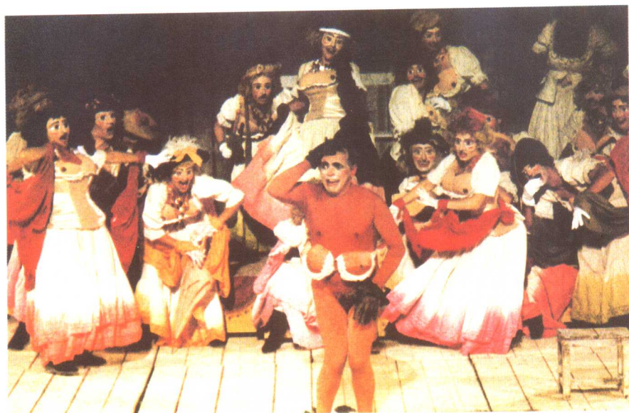
阿里斯托芬的喜剧剧照