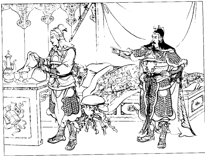
(8) 汉王命从人揭起锦被,将印拿走。