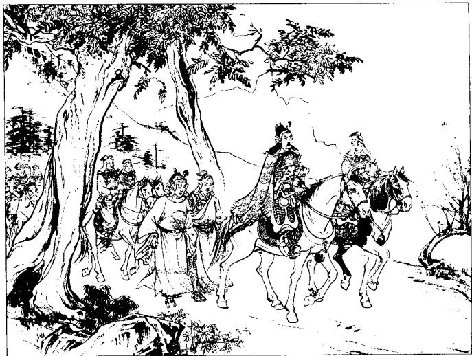
(11) 汉王便将元帅印取归大营，韩信、张耳随于马后步行。